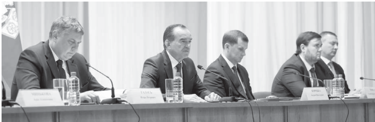
Губернатор Краснодарского края Вениамин Кондратьев с рабочей поездкой побывал в Приморско-Ахтарском районе