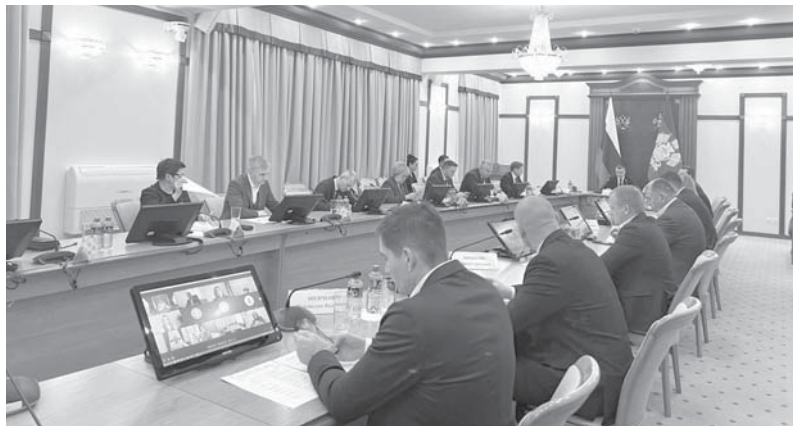
Заместитель Губернатора Краснодарского края Александр Руппель провел совещание по подготовке к зимнему туристическому сезону

Заместитель Губернатора Краснодарского края Александр Руппель провел совещание по подготовке к зимнему туристическому сезону.