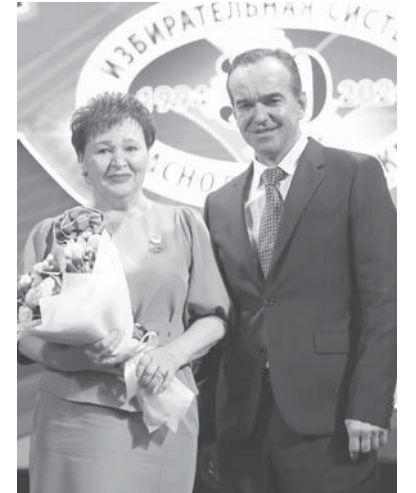
Губернатор Краснодарского края Вениамин Кондратьев принял участие в мероприятии, посвященном работе избирательной системы

Затем Почетной грамотой Президента Российской Федерации на торжественном мероприятии отметили трех сотрудников Управления аппарата краевой избирательной комиссии, еще двенадцать сотрудников территориальных избирательных комиссий поощрили медалями «За выдающийся вклад