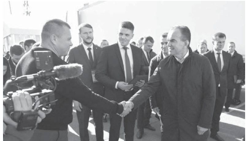
Губернатор Краснодарского края Вениамин Кондратьев принял участие в Международной агропромышленной выставке «ЮГАГРО-2024».

— Еще три года назад такая почвообрабатывающая техника была импортной. Мы разработали и выпускаем свои модели. Сегодня они пользуются спросом у аграриев, помогают получать достойные урожаи. Если спрос явно превышает предложение, значит, краевая господдержка достигла своей цели,— сказал Вениамин Кондратьев.