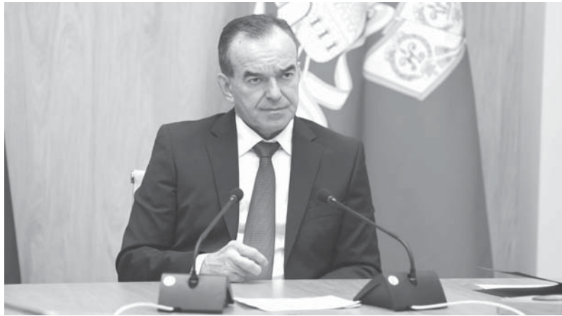
Губернатор Краснодарского края Вениамин Кондратьев провел совещание, на котором речь шла об итогах и планах работы по созданию современных зеленых зон

Губернатор Краснодарского края Вениамин Кондратьев провел совещание, на котором речь шла об итогах и планах работы по созданию современных зеленых зон.