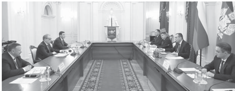
Губернатор Краснодарского края Вениамин Кондратьев принял участие в церемонии награждения победителей смотра-конкурса на лучшую организацию работы среди субъектов страны в области мобилизационной подготовки

Губернатор Краснодарского края Вениамин Кондратьев принял участие в церемонии награждения победителей смотра-конкурса на лучшую организацию работы среди субъектов страны в области мобилизационной подготовки.