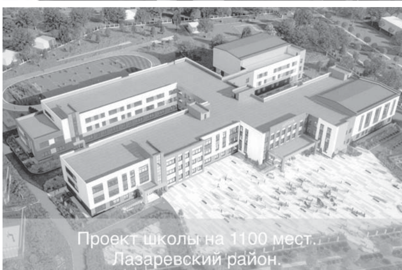
Проект школы на 1100 мест. Лазаревский район.