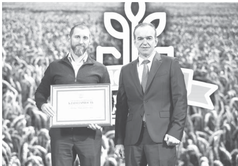
Губернатор Краснодарского края Вениамин Кондратьев наградил лучших сотрудников Национального центра зерна имени Петра Лукьяненко

— Большой путь научного центра с мировым именем начинался с сельскохозяйственной опытной станции в 1914 году. Тогда урожайность озимой пшеницы была всего восемь центнеров с гектара, а в этом году в непростых погодных условиях аграрии получили по шестьдесят пять центнеров. А сорт «школа», выведенный в Национальном центре зерна, установил в Тбилиском районе всероссийский рекорд: дал больше ста девяти центнеров с гектара. Ученые центра за всю его историю создали свыше восьмисот сортов и гибридов разных сельскохозяйственных культур. И они востребованы: кубанские