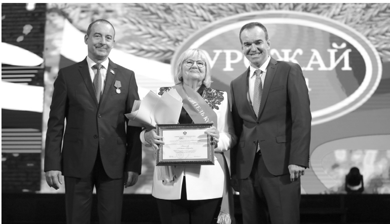
Губернатор Краснодарского края Вениамин Кондратьев принял участие в торжественном мероприятии, посвященном Дню урожая.

На празднике присутствовали заместители Губернатора Краснодарского края, представители федеральной власти, руководители ведомств, главы районов, специалисты сельского хозяйства.