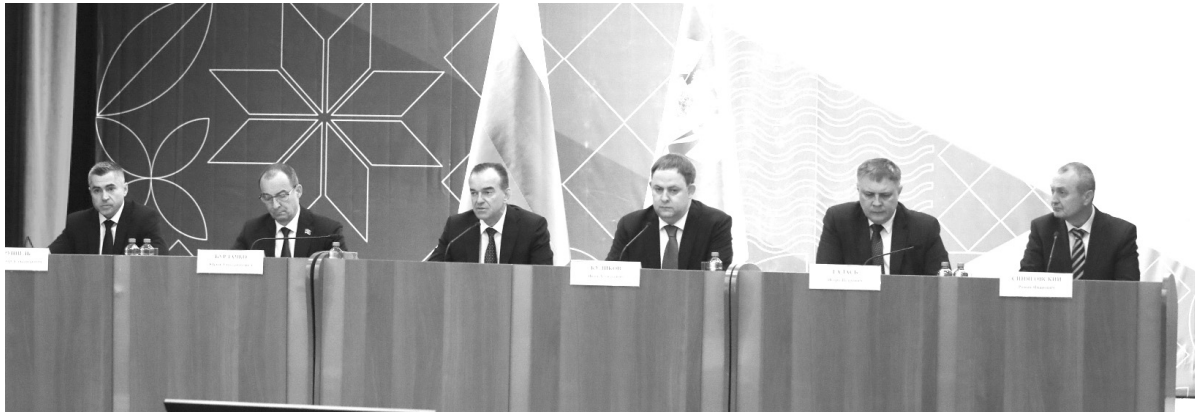
Губернатор Краснодарского края Вениамин Кондратьев с рабочим визитом побывал в Славянском районе.

На нем отметили большую работу Губернатора Краснодарского края по созданию эффективной системы развития промышленного комплекса региона. В рейтинге эффективности органов исполнительной власти в сфере промышленности