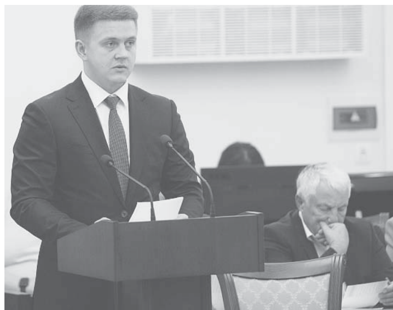
Подготовила Марина ВЛАДИМИРОВА

По итогам работы была принята резолюция. Профильному министерству рекомендовано взять на контроль процесс заготовки теплоэнергетическими предприятиями топлива для объектов социальной сферы. Главам районов предстоит мониторить своевременную и полную оплату задолженности муниципальных предприятий ЖКХ за потребленные энергоресурсы.