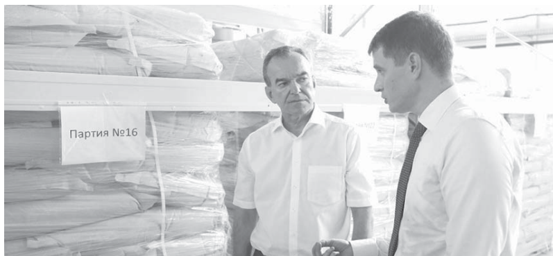
Губернатор Краснодарского края Вениамин Кондратьев встретился с руководством компании, которая реализовала уникальный проект создания высокотехнологического производства

Губернатор Краснодарского края Вениамин Кондратьев встретился с руководством компании, которая реализовала уникальный проект создания высокотехнологического производства.