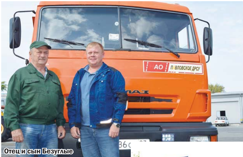
Отец и сын Безуглые