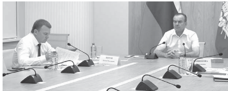
Губернатор Краснодарского края Вениамин Кондратьев принял участие в федеральном совещании по обращению с твердыми коммунальными отходами

В 2024 году началась реконструкция полигона в Белореченске,