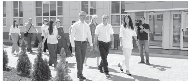
В Горячем Ключе Губернатор Краснодарского края Вениамин Кондратьев ознакомился с социально-экономическим развитием муниципалитета

— На входе получаем чистую воду. А на выходе — проблемы с трубами. Они колоссально изношены. Инфраструктуру надо менять системно, как и по всему краю, и делать это быстро,— отметил Губернатор Краснодарского края.