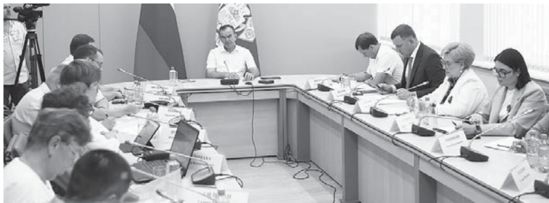
Губернатор Краснодарского края Вениамин Кондратьев провел совещание, на котором рассмотрели концепцию формирования стратегического градостроительного документа Краснодара

Губернатор Краснодарского края Вениамин Кондратьев провел совещание, на котором рассмотрели концепцию формирования стратегического градостроительного документа Краснодара.