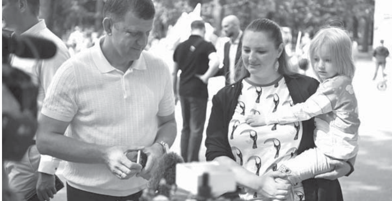
Глава города Краснодара Евгений Наумов посетил четвертый детский инклюзивный праздник «Город дружбы», который прошел в Чистяковской роще

Глава города Краснодара Евгений Наумов посетил четвертый детский инклюзивный праздник «Город дружбы», который прошел в Чистяковской роще.