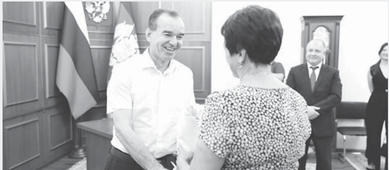
Вениамин Кондратьев провел прием граждан

Губернатор Краснодарского края Вениамин Кондратьев провел прием граждан.