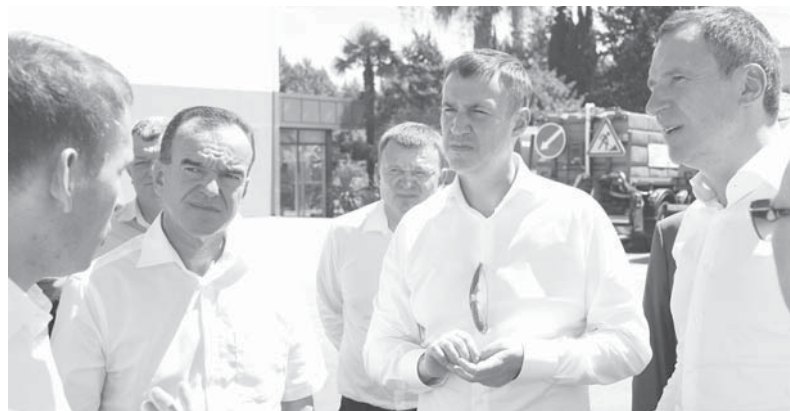
Вениамин Кондратьев принял участие в совещании, посвященном реализации реформы в области обращения с твердыми коммунальными отходами

Перед совещанием Вениамин Кондратьев с премьер-министром совершили вертолетный облет полигона твердых коммунальных отходов в Белореченске. Затем в Сочи они посетили новый