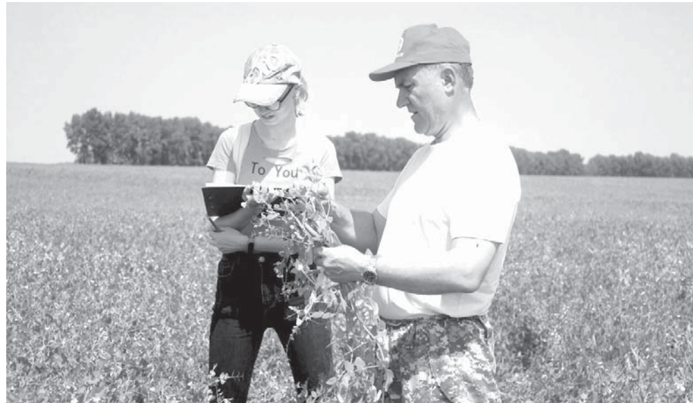
Кубанские фермеры делают упор на выращивании экологически чистой продукции

К сказанному фермером добавлю, что кубанские аграрии понимают важность выращивания экологически чистой, качественной и вкусной продовольственной продукции,