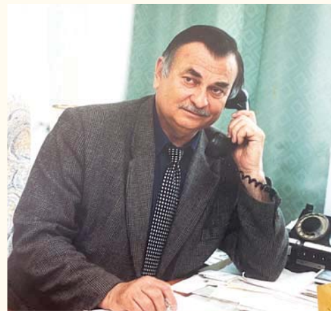
В 1963 году прошел обучение в Краснодарском аэроклубе по курсу пилотов на самолете типа ЯК-18, выполнил 207 полетов.

Так, он прекрасно играет на баяне, что неудивительно. В 1961 году окончил музыкальный факультет Заочного народного университета искусств.