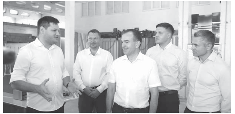
Губернатор Краснодарского края Вениамин Кондратьев побывал в Крымске с рабочим визитом

— На базе завода создан инженеринговый центр, сотрудники которого разработали и внедрили уникальное аппаратно-программное обеспечение управления лифтовым оборудованием. Необходимо активнее привлекать молодых специалистов. Сегодня именно они смогут обеспечить технологический прорыв, используя передовые разработки и технологии,—