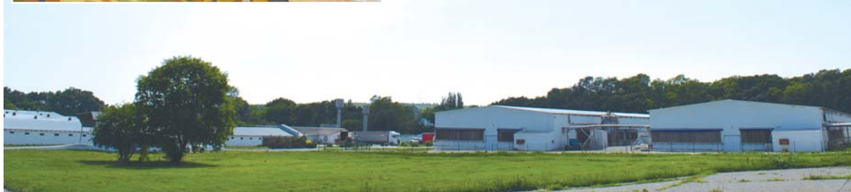
Просторная территория птицефабрики в Натухаевской поражает идеальной чистотой и обилием зелени