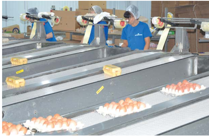
В сортировальном цехе на птицефабрике в Натухаевской

— Например, мы полностью исключили из рациона кур корма животного происхождения. Совершенно никакой мясо-костной муки и других животных ингредиентов. Даже отходы нашего мясного производства мы не используем. Более того, ГОСТы позволяют использовать корма с содержанием животных белков, но мы этого не делаем. Во-первых, курице природой определено клевать растительную пищу. Во-вторых, при использовании животных кормов есть риск, пусть и минимальный, получить неприятности в виде заражения