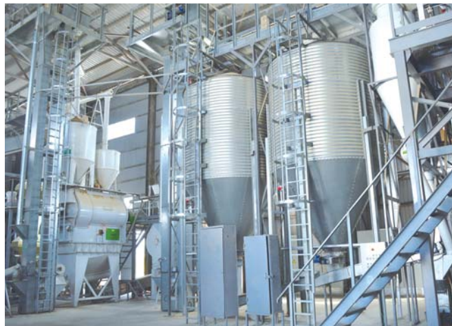
На комбикормовом заводе в станице Раевской установлено современное оборудование, которое управляется одним оператором