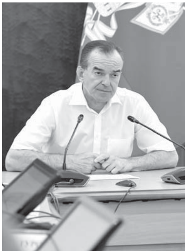
Губернатор Краснодарского края Вениамин Кондратьев провел совещание, посвященное размещению нестационарных торговых точек

Губернатор Краснодарского края Вениамин Кондратьев провел совещание, посвященное размещению нестационарных торговых точек.