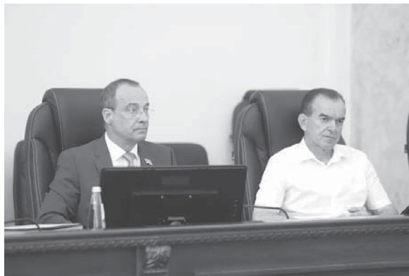
Председатель Законодательного Собрания Кубани Юрий Бурлачко разъяснил, что Краснодарский и Ставропольский края обязаны выполнить распоряжение

Двадцатого июня в ходе сессии депутаты ЗСК приняли закон о заключении соглашения об установлении границы между Краснодарским и Ставропольским краями.