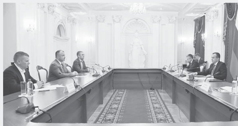
Губернатор Краснодарского края Вениамин Кондратьев провел рабочую встречу с одним из учредителей компании по производству холодильного оборудования в регионе

Губернатор Краснодарского края Вениамин Кондратьев провел рабочую встречу с одним из учредителей компании по производству холодильного оборудования в регионе.