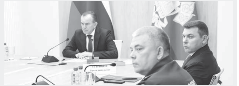
Губернатор Кубани Вениамин Кондратьев принял участие в заседании Правительственной комиссии по предупреждению и ликвидации последствий природных явлений

Губернатор Краснодарского края Вениамин Кондратьев принял участие в заседании Правительственной комиссии по предупреждению и ликвидации последствий природных явлений.