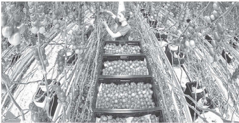
В Староминском районе ежегодно растет количество теплиц

Государственная поддержка сельхозпредприятий — мощный стимул для развития сельхозпредприятий Староминского района. В прошлом