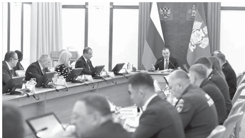
Губернатор Краснодарского края Вениамин Кондратьев провел расширенное заседание межведомственной комиссии по вопросам организации отдыха и оздоровления детей

— Мы должны организовать безопасность на высочайшем уровне — это наш приоритет. И здесь важно эффективное межведомственное взаимодействие и ответственный подход всех служб. Нельзя недооценивать ситуацию — в современных условиях мы должны быть особенно внимательны. Все проверки по соблюдению требований безопасности в здравницах необходимо завершить до начала лета, — акцентировал внимание участников заседания губернатор Краснодарского края.