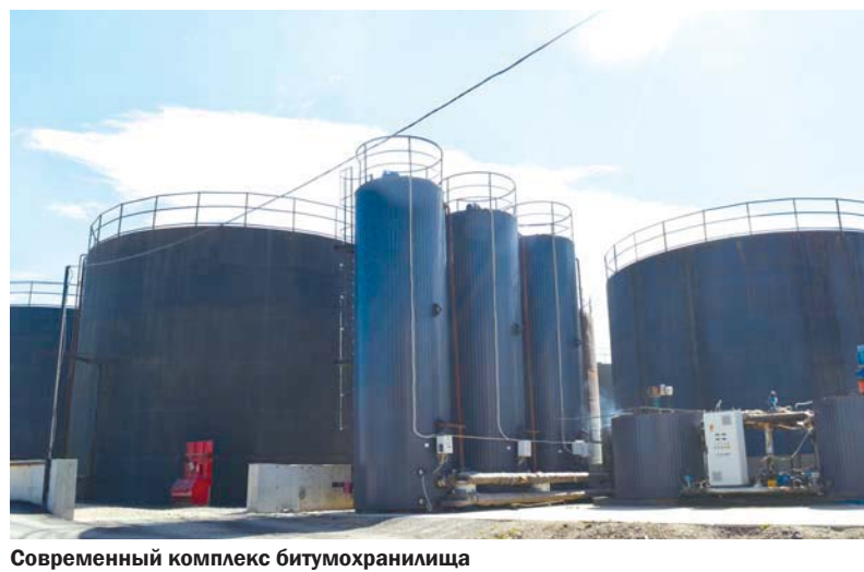
Современный комплекс битумохранилища