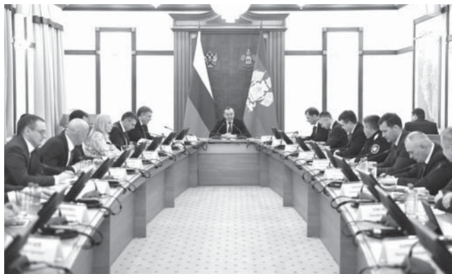
Губернатор Краснодарского края Вениамин Кондратьев провел расширенное планерное совещание со своими заместителями и руководителями профильных министерств и ведомств

Он также уточнил, что по итогам прошлого года в крае существенно нарастили несырьевой экспорт агропродукции, его доля в общем объеме экспорта превысила сорок процентов. Пять лет назад это было около двадцати процентов.