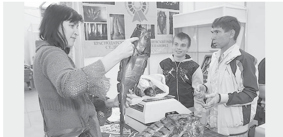
Выставка «Кубанская ярмарка» проводится при поддержке администрации Краснодарского края

На сельхозпредприятии создана роботизированная ферма и особенность производства состоит в том, что аграрии сами выращи-