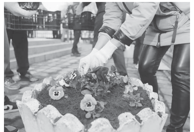
Четырнадцатого марта в Прикубанском округе прошел субботник

А в нынешнем году планируется благоустройство еще пяти территорий, которые стали победителями краевого конкурса местных инициатив. Сделают прогулочные дорожки, освещение, уста-