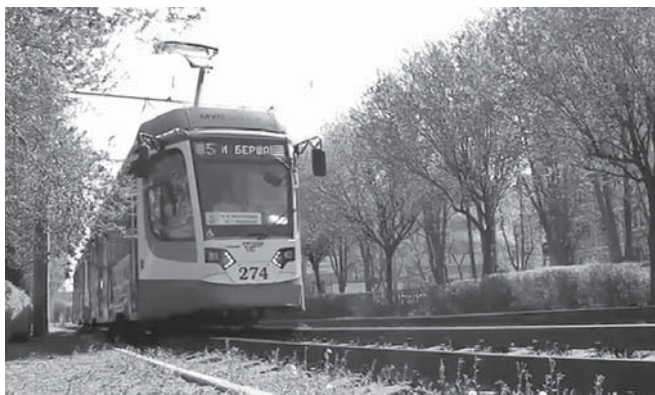
Вишня Писсарди на улице Ставропольской

могут участвовать как в создании новых, так и в поддержании в хорошем состоянии уже существующих зеленых уголков, краснодарцы считают важным. Индекс качества среды движется вверх не сам по себе — он общим трудом прирастает, а весна для таких работ — самое подходящее время.