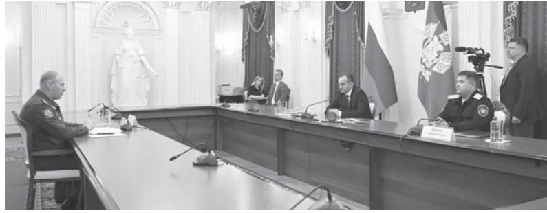
Губернатор Краснодарского края Вениамин Кондратьев провел рабочую встречу с военным комиссаром региона

Губернатор Краснодарского края Вениамин Кондратьев провел рабочую встречу с военным комиссаром региона.