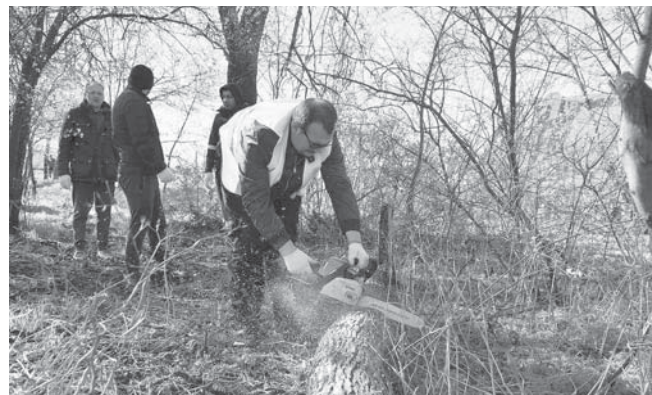
Четырнадцатого марта в Прикубанском округе Краснодара прошел субботник

— Проект благоустройства сквера Памяти Героев-Танкистов проработали с акти-