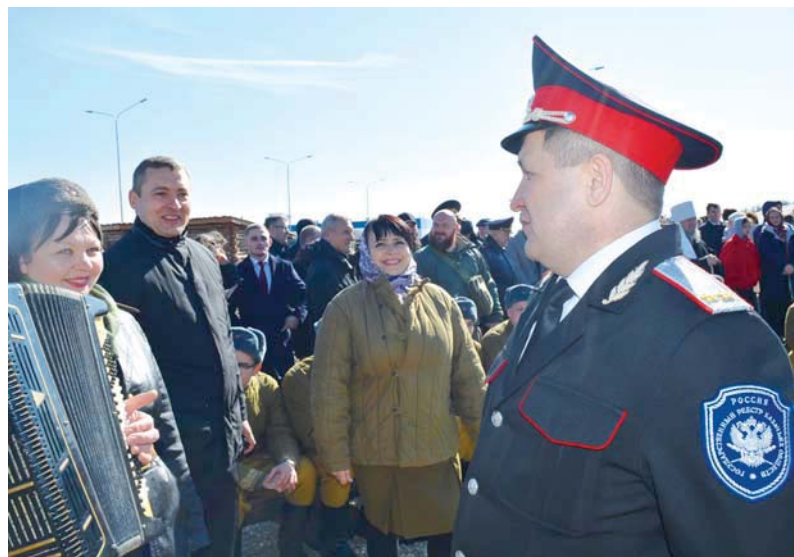
В партизанской деревне играла гармонь, звучали песни, варилась каша в котелке...

— Прямо сейчас мы являемся участниками исторического момента. Увидеть его масштаб можно уже сейчас, но в полной мере осознать всю его важность получится только спустя время. Именно так