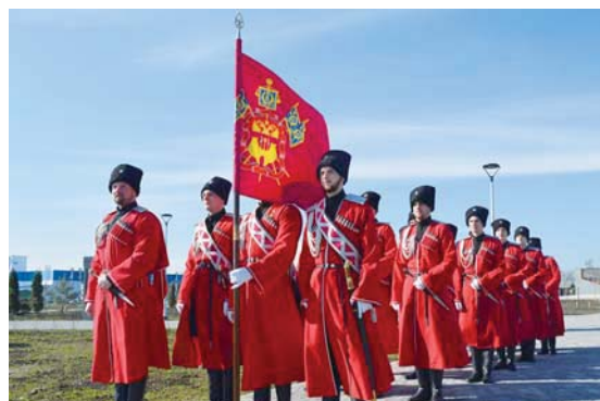
Почетный караул Кубанского казачьего войска к параду готов