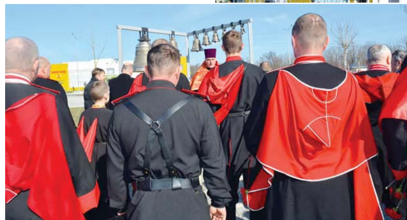
Традиционная молитва перед началом события

молодежная политика — основанная на традициях предков. Нет сомнения, что благодаря открытию Центра имени Героя России Виктора Казанцева Краснодарский край