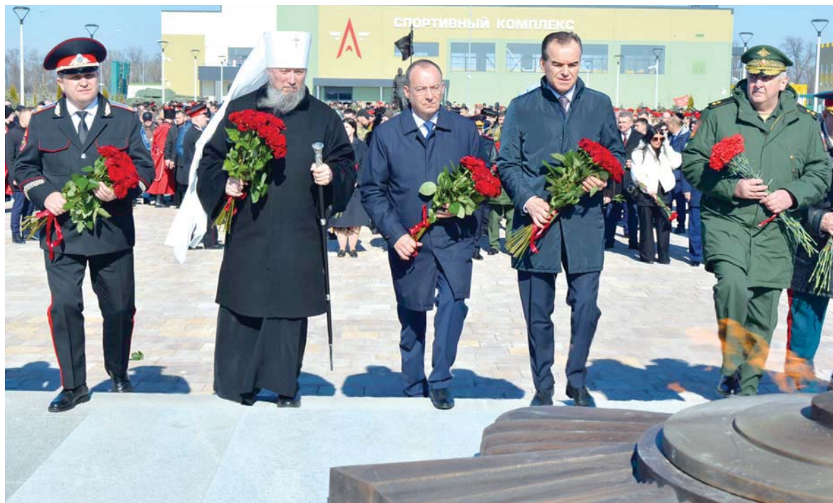
В церемонии открытия центра «Патриот» принял участие Губернатор Краснодарского края Вениамин Кондратьев и другие высокие гости

А во главе всего этого комплекса — мемориал «Преемственность поколений», где и состоится церемония открытия. Это настоящее сердце военно-патриотического центра. Напротив мемориала, где будет зажжен Вечный огонь, установлен памятник воинам, защищавшим Родину в мирное время и делающим это сейчас. Тут же бюст Героя России генерала армии В. Г. Казанцева. И очень символично, что все дороги военно-