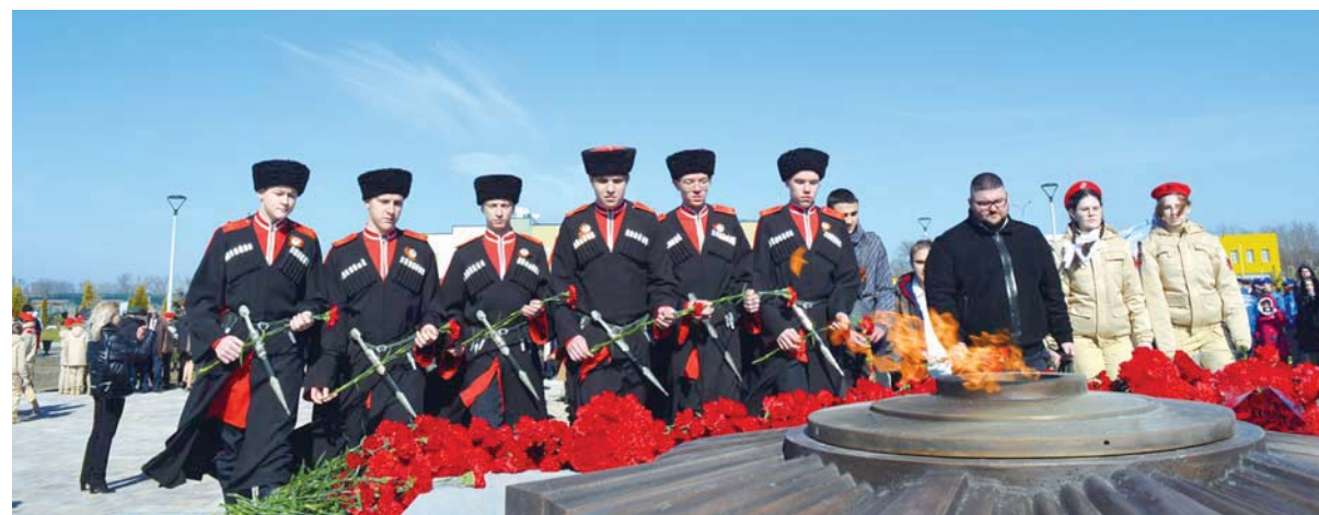
Возложение цветов — шеренга за шеренгой...