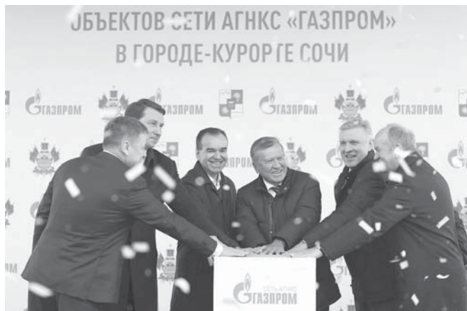
В открытии в регионе новых двух газозаправочных станций принял участие Губернатор Краснодарского края Вениамин Кондратьев

Было озвучено, что в автопарке города сегодня более 180 автобусов работает на газомоторном топливе. В ближайшее время город