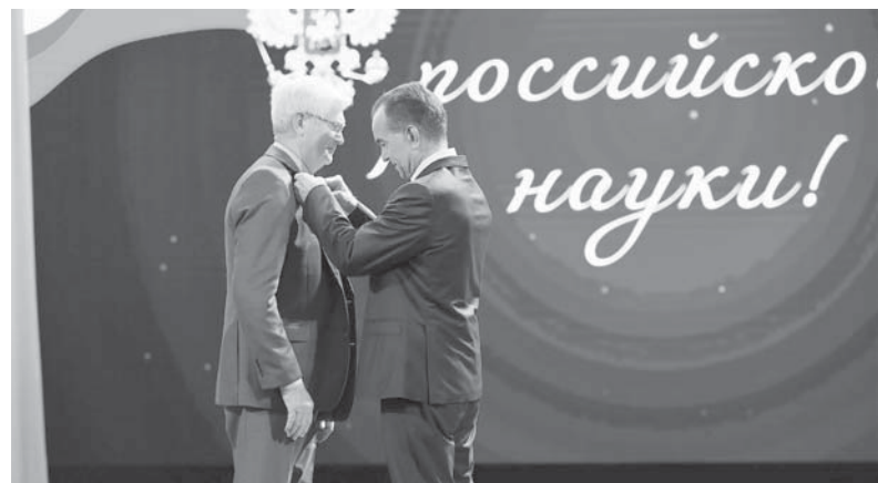
Губернатор Краснодарского края Вениамин Кондратьев принял участие в мероприятии, которое было посвящено Дню российской науки

Как сказал Вениамин Кондратьев, инновационные научные идеи обеспечивают превосходство любого государства во всех сферах жизнедеятельности.