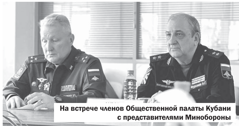
На встрече членов Общественной палаты Кубани с представителями Минобороны

Для того чтобы воспользоваться возможностью проголосовать вне своего избирательного участка, нужно заранее подать заявление. Сделать это можно уже сейчас. Начиная с 29 января по 11 марта заявление можно подать через портал госуслуг, в МФЦ или в своей территориальной избирательной комиссии. А с шестого по одиннадцатое марта заявление примут в участковой избирательной комиссии по месту жительства гражданина.