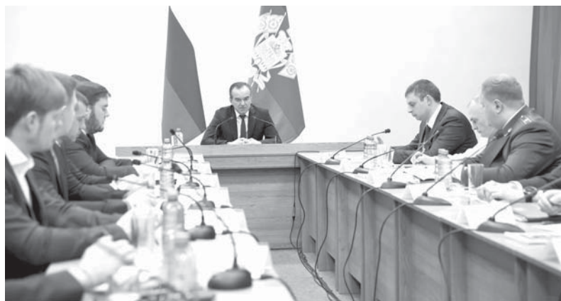
Губернатор Краснодарского края Вениамин Кондратьев побывал в одном из муниципальных образований Кубани

Затем Вениамин Кондратьев побывал на земельном участке в Ильском. Участок первоначально предназначался для строительства коммунальных объектов. Затем 6,8 гектара земли передали коммерческой организации, разделили на 61 участок под индивидуальное