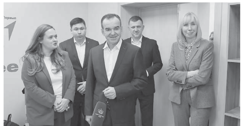
Губернатор Краснодарского края Вениамин Кондратьев побывал в Доме молодежи, который капитально отремонтировали

Как отметил Вениамин Кондратьев, на Кубани помогают раскрыться творческим личностям. В этом