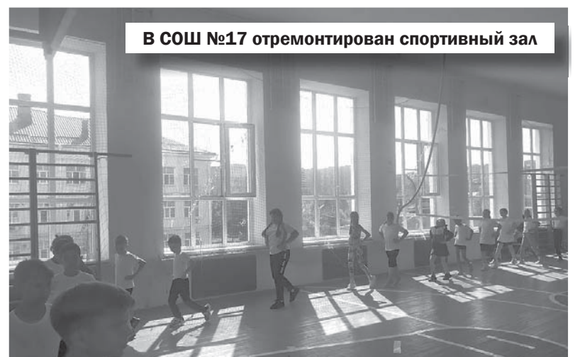
В СОШ №17 отремонтирован спортивный зал