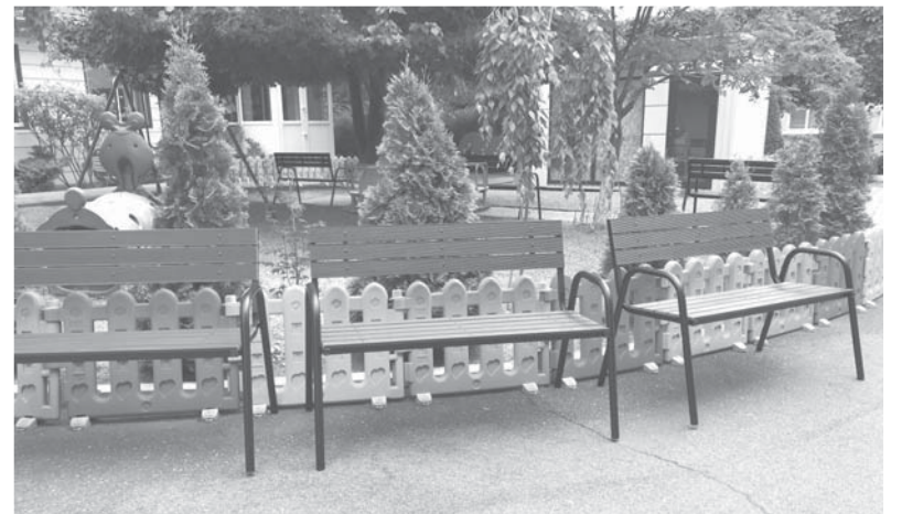
Благодаря средствам, выделенным депутатом ЗСК, для детского сада №24 приобретено уличное оборудование