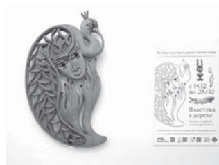
шой источник вдохновения для творческих людей.