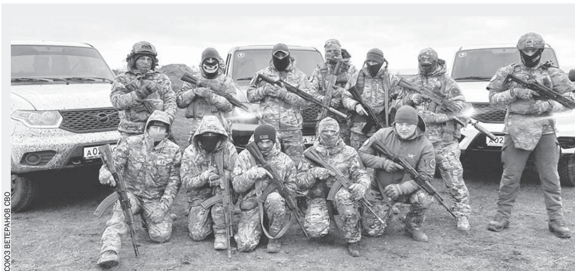
СОЮЗ ВЕТЕРАНОВ СВО

В этом году на отдых в отели и санатории бесплатно отправлено 346 участников