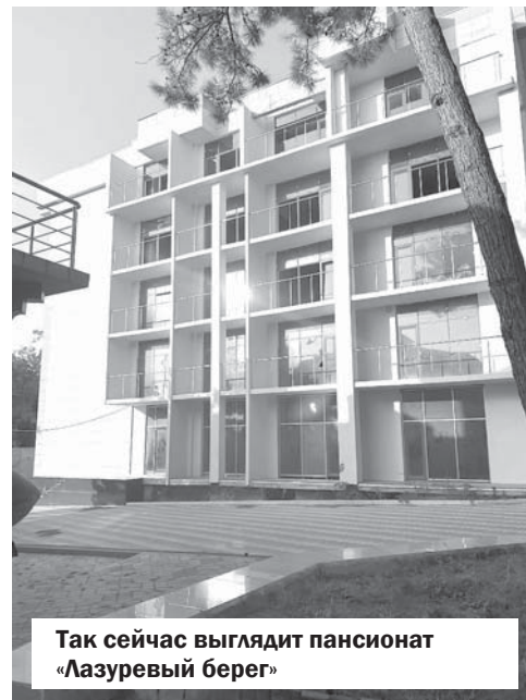
Так сейчас выглядит пансионат «Лазуревый берег»

нарушения и устраняло. Однако это не защитило от иска администрации города о расторжении договора об аренде с ООО «Пансионат с лечением „Лазуревый берег“». Мотивировка, конечно, очень интересная. Например, среди «преступлений» пансионата указано, что «на спорном земельном участке размещен самовольный объект капитального строительства — апарт-отель» (выдержка из искового заявления). То есть здание, которое является объектом первой очереди реконструкции, одобренной на уровне краевой администрации, и не введено в эксплуатацию из-за отсутствия разрешения