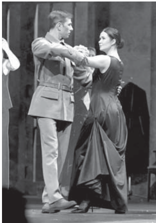
вовании и призывает жить, несмотря ни на что.

Итог происходящего на сцене зрители слышат в кратком монологе Левина: он ставит точку в повест-