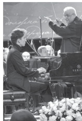
молодых музыкантов, — подчеркнул художественный руководитель и генеральный