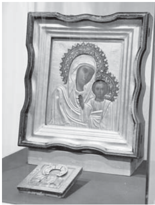
Выставка будет работать с 14 декабря по 28 января адресу: г. Краснодар, ул. Красная, 13, этаж 2.

В экспозиции можно будет увидеть отдельные образцы народного изобразительного искусства, которые на рубеже XIX—XX веков относили к категории «примитива», такие как «Казак Мамай» и «Эсфирь» кисти неизвестных народных мастеров XIX века.