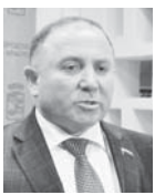
Зорик САДОЯН, заместитель председателя городской Думы Краснодара, председатель комитета по вопросам местного самоуправления:

За счет экономии и безвозмездных поступлений из бюджета края удалось уменьшить дефицит местного бюджета на один миллиард рублей.