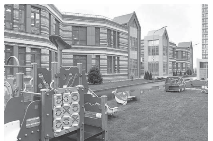
Завершено строительство детского сада в поселке Российском

— Все строительные работы завершили в октябре, а сейчас пройдены проверки