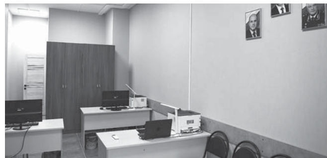
Подготовила Людмила БУРКИНА

На страже порядка — три участковых уполномоченных полиции. Пункт полностью укомплектован необходимой оргтехникой и мебелью. Жители района могут решать здесь вопросы правопорядка, общественной безопасности и многое другое.