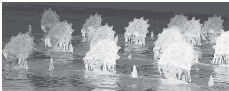
Фрагмент шоу олимпийских чемпионов

Увеличивается количество тренеров и организаций, которые популяризируют наш вид спорта как в бюджетных, так и в коммерческих структурах. Синхронное плавание оказывается всё более на слуху.