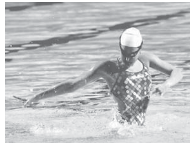
Мастер-класс на фестивале синхронного плавания

— Шоу олимпийских чемпионов — это смесь спорта и искусства. Лично мне по заряженности, энергетике, насыщенности оно в большей степени спорт напомнило. А вот спектакль «Живая вода», который тоже могли видеть жители Краснодара и гости города в рамках фестиваля, сильнее