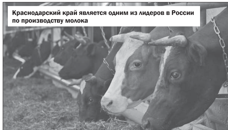
Краснодарский край является одним из лидеров в России по производству молока

Одним из масштабных проектов в сфере переработки, реализуемых в Краснодарском крае, можно назвать строительство второй очереди тепличного комплекса, специализация которого — подготовка компоста и выращивание шампиньонов.