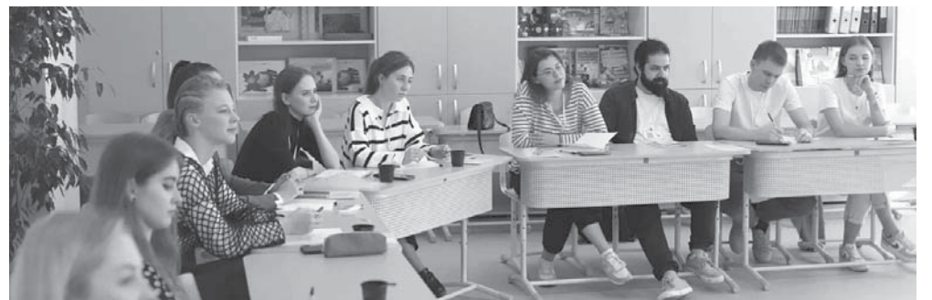
В Краснодаре стартовал форум молодых педагогов «Современный педагог — взгляд в будущее»

Директор Департамента образования Краснодара Александр Звягинцев рассказал о старте в Краснодаре форума молодых педагогов «Современный педагог — взгляд в будущее».