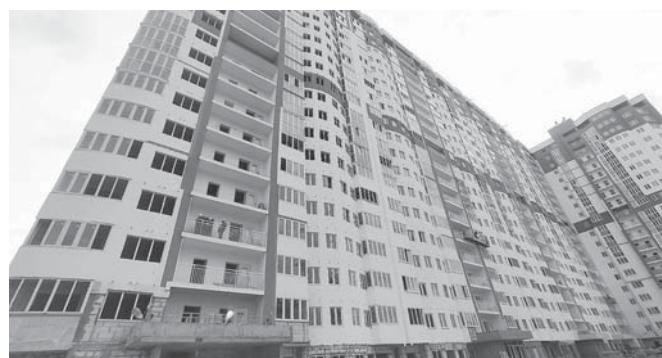
Подготовила Людмила БУРКИНА

Достройка проблемных жилых домов в Краснодаре — результат работы, которая идет по поручению Губернатора Кубани вместе с администрацией Краснодарского края и прокуратурой края и города.