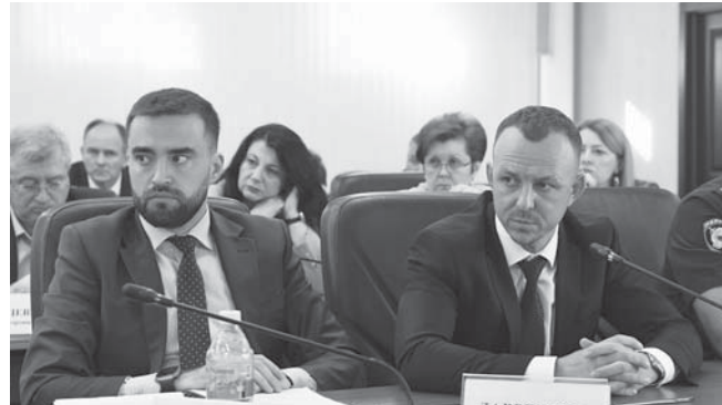
Совещание, в ходе которого обсудили работу журналистов и сотрудников Муниципального центра управления