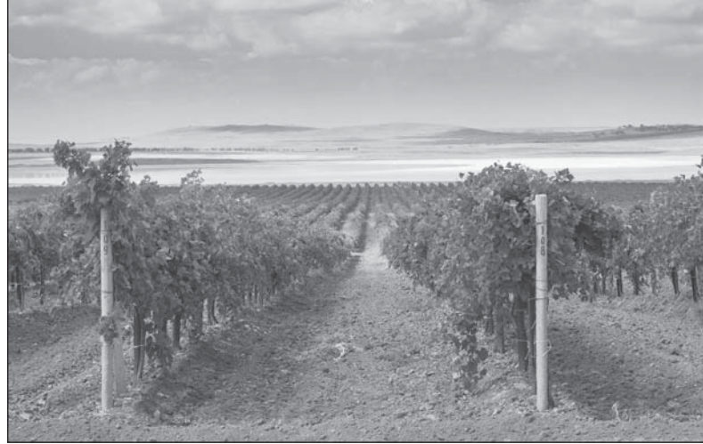
Кубанские виноградари ежегодно увеличивают площади янтарной ягоды

Семенами кубанского гибрида в прошлом году в регионе засеяли несколько гектаров. В этом году было засеяно 185 гектаров, с которых аграрии получили две с половиной тонны семян.