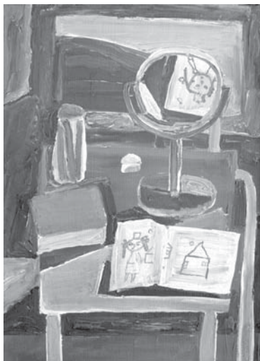
В экспозиции представлена серия из двухсот натюрмортов, главным