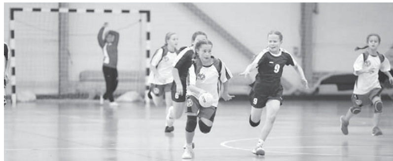
В атаке сборная Краснодарского края

— На самом деле, невзирая на крупные счета, все матчи можно назвать сложными. Дети, особенно девочки, — это еще совершенно непредсказуемые игроки. Сегодня они удачно играют — завтра нет. Сейчас один ребенок удачно себя проявил — на следующий день уже другой. Поэтому важно было настраиваться на каждую игру.