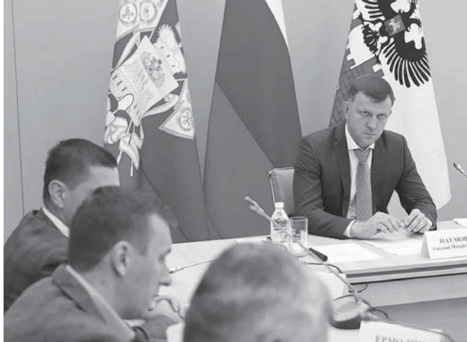
Глава города Краснодара Евгений Наумов провел совещание по переходу на региональную платформу — АПК «Безопасный город».

Глава города Краснодара Евгений Наумов провел совещание, в ходе которого обсудили переход краевого центра на региональную платформу видеонаблюдения — АПК «Безопасный город».