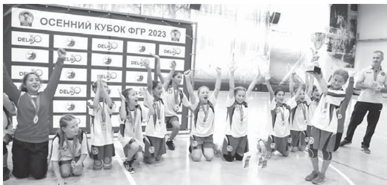
Сборная Краснодарского края на Осеннем кубке — 2023

— Да. Хорошо, что все дети поиграли вдоволь. Не было такого, что семь-восемь человек играют ради