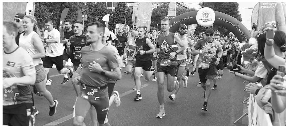
В легкоатлетическом забеге «Кросс Нации» – 2023 в Краснодаре участвовали только победители

– Не сбавляем обороты – за последние два дня открываем третий спортобъект в Краснодаре! – сообщил в своем Телеграме краснодарский мэр, второго сентября принявший участие в церемонии открытия физ-