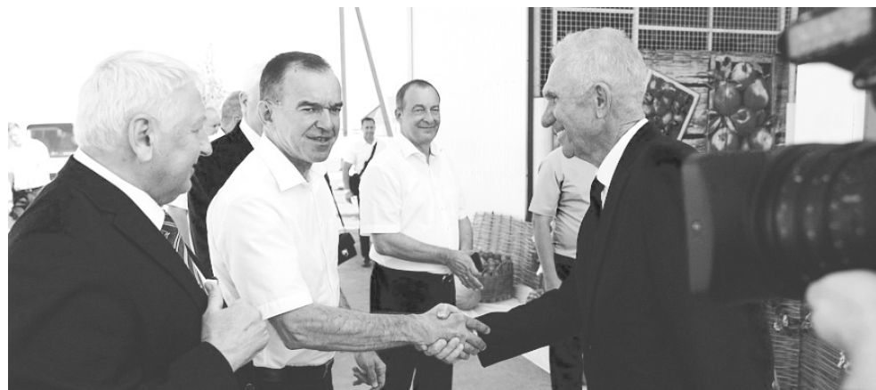
Вениамин Кондратьев посетил крестьянское (фермерское) хозяйство в Красноармейском районе

В крестьянском (фермерском) хозяйстве, которое является одним из передовых в Красноармейском районе, побывал Губернатор Краснодарского края Вениамин Кондратьев.