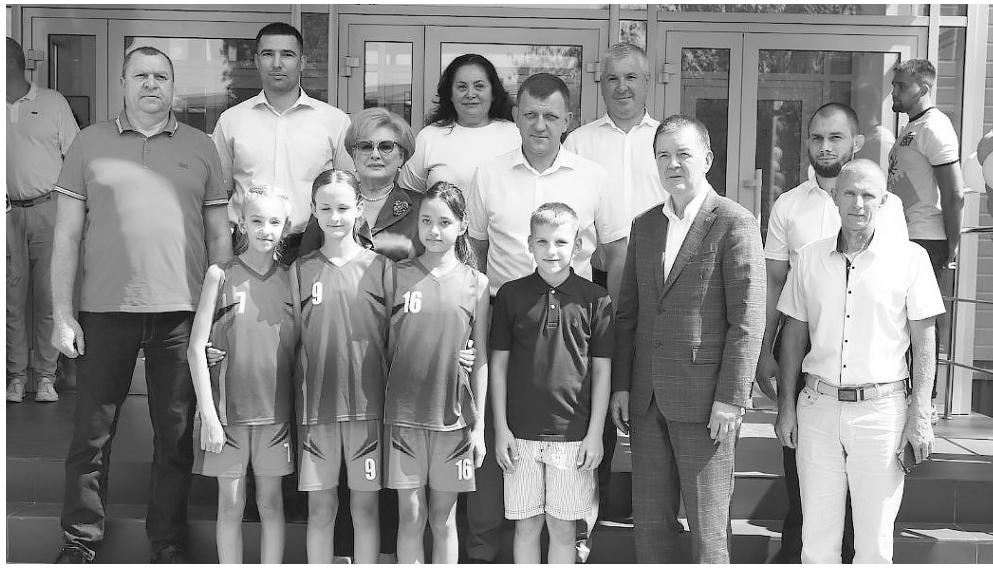
Евгений Наумов на церемонии открытия физкультурно-оздоровительного комплекса на улице Вавилова

Глава города считает, что сама атмосфера легендарного стадиона будет помогать тем, кто здесь тренируется, становиться спортивными звездами первой величины.