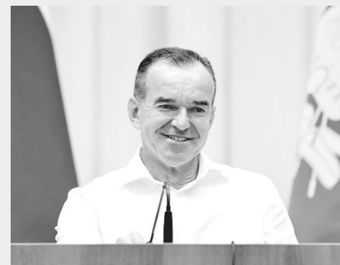
Губернатор Краснодарского края Вениамин Кондратьев на съезде АККОР

По мнению Губернатора Краснодарского края, для дальнейшего развития необходимо создавать кооперативы еще на стадии