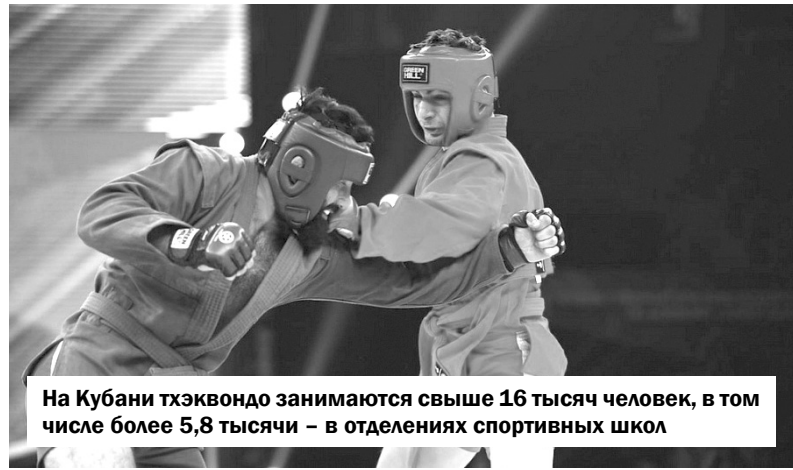
На Кубани тхэквондо занимаются свыше 16 тысяч человек, в том числе более 5,8 тысячи – в отделениях спортивных школ

Говоря о единоборствах в Краснодарском крае, обойти вниманием самбо просто нельзя. Этот вид единоборств снискал у кубанцев колоссальную популярность. Самбо в регионе сегодня занимаются тысячи человек от мала до велика. Занятия по этой дисциплине проводят в школах. По состоянию на прошлый год, в спортивных школах и секциях в крае самбо занимались свыше семи тысяч человек, а в проекте «Самбо в школу» участвовали больше 330 тысяч детей.