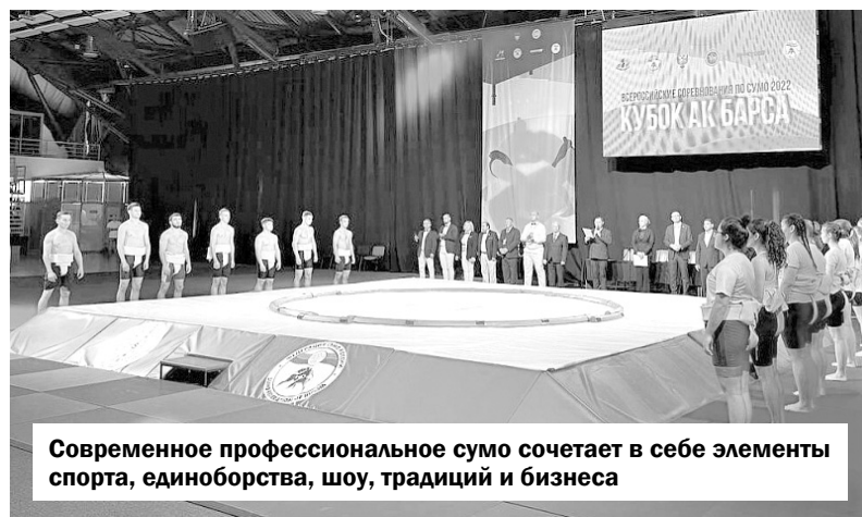
Современное профессиональное сумо сочетает в себе элементы спорта, единоборства, шоу, традиций и бизнеса

Однако по разным причинам олимпийским видом спорта самбо признали только в позапрошлом году.