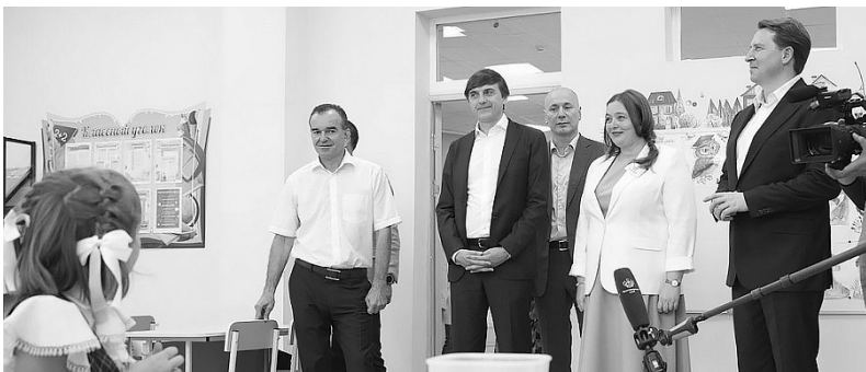
Губернатор Краснодарского края Вениамин Кондратьев побывал в Сочи с рабочим визитом

С рабочим визитом в Сочи побывал Губернатор Краснодарского края Вениамин Кондратьев.