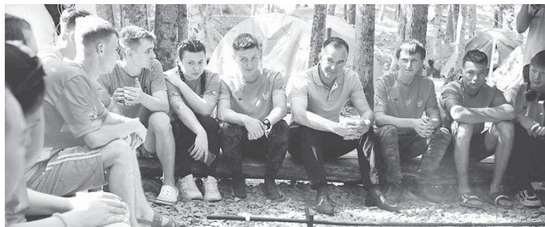
Вениамин Кондратьев побывал в молодежном лагере «Регион 93»

Губернатор Краснодарского края Вениамин Кондратьев побывал в молодежном лагере «Регион 93».