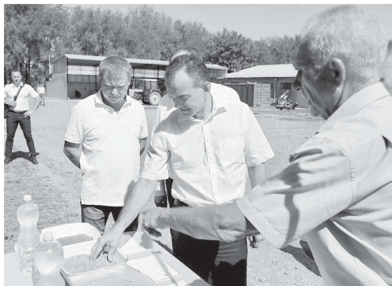
Губернатор Краснодарского края Вениамин Кондратьев побывал с рабочим визитом в одном из районов края

Вениамин Кондратьев отметил, что предприятия легкой промышленности должны работать на полную мощность. Растить и развиваться. Для этого нужно привлекать молодежь. Сегодня рабочие руки важны как никогда — необходимо решать проблему дефицита кадров, тем более когда есть заказы, рынок сбыта. В этом залог успеха,