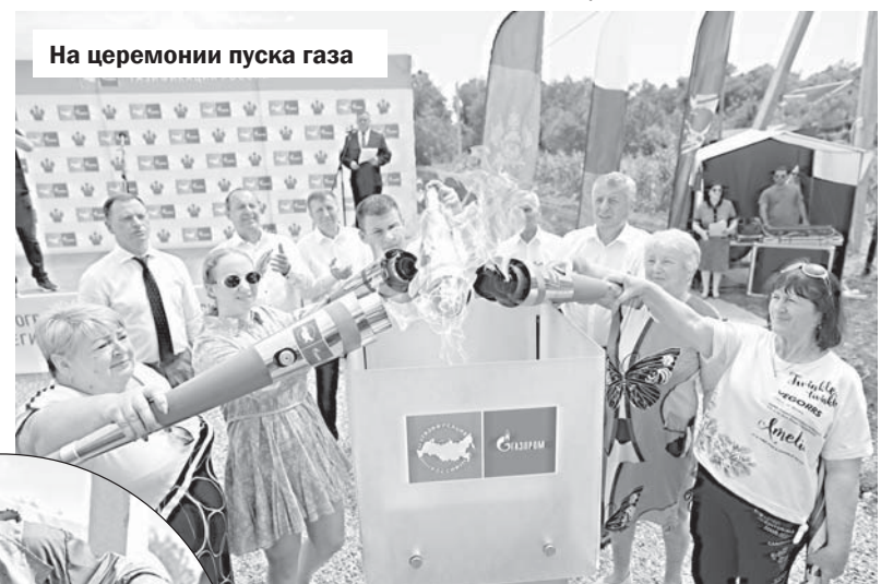
На церемонии пуска газа

На недавнем совещании губернатор говорил о необходимости максимально отработать весь потенциал данной программы,