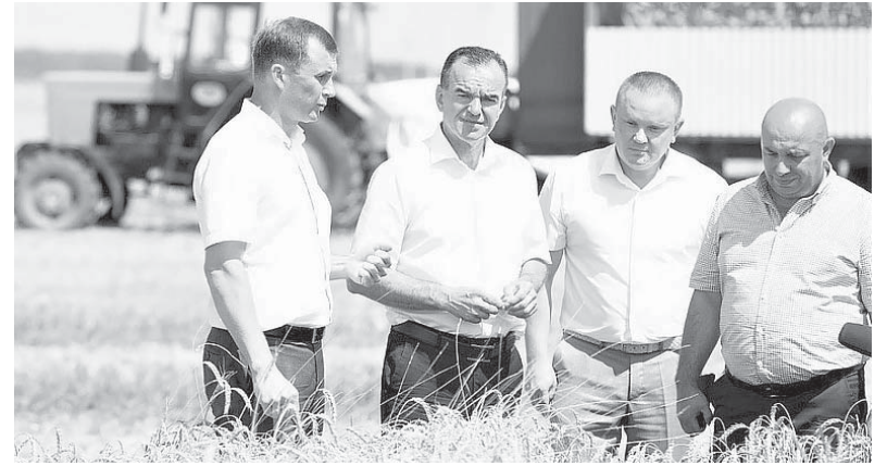
Губернатор Краснодарского края Вениамин Кондратьев оценил ход уборочной кампании на полях одного из районов региона

— Покупать импортные — это близорукость. Мощная селекционная база, технические возможности, опыт агрономов — всё это вместе обеспечит хорошие урожаи. А также господдержка. В прошлом году аграрный сектор получил порядка