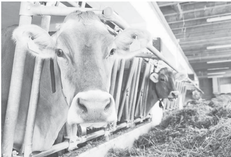
Краснодарский край — один из лидеров в Российской Федерации по производству молока

Можно с полной уверенностью говорить о том, что поддержка со стороны государства дает возможность районному агропромышленному комплексу динамично развиваться. Сельхозпредприятия всех форм собственности, благодаря предоставляемым грантам и субсидиям, наращивают свои производства, производят качественную продукцию и увеличивают количество рабочих мест.