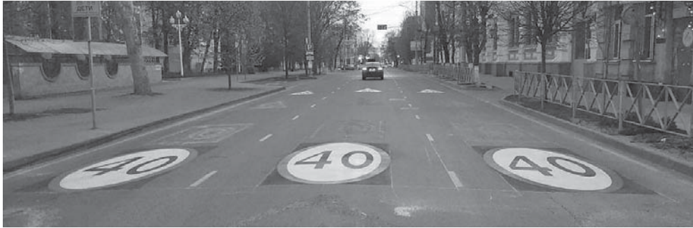
Трафареты с предупреждающими знаками «Дети» и «Ограничение максимальной скорости» уже нанесли с помощью термопластика вблизи восьми школ