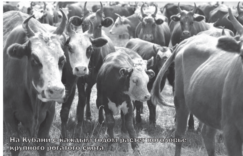
На Кубани с каждым годом растет поголовье крупного рогатого скота

Для выполнения этой задачи в крае была принята Стратегия социально-экономического развития Краснодарского