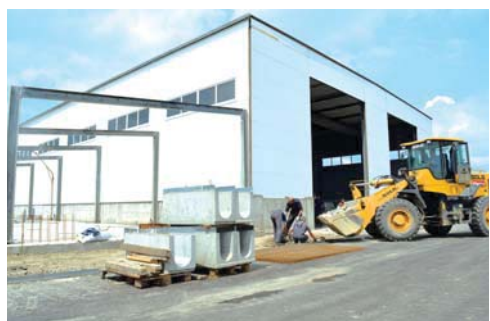
Площадь нового цеха металлообработки составит тысячу квадратных метров. Здесь будет всё для производства и обработки металлоизделий

АПВГК на территории края и приняло участие в строительстве еще шести пунктов в Адыгее и на Ставрополье.