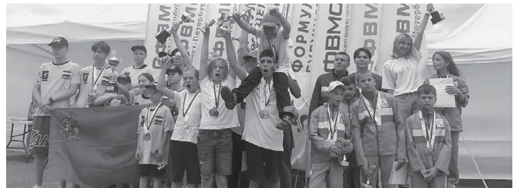
Краснодарцы — победители и призеры первенства России по водно-моторному спорту, прошедшего в Санкт-Петербурге