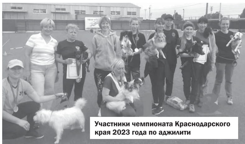
Участники чемпионата Краснодарского края 2023 года по аджилити

— Кстати, в апреле состоялся чемпионат России в Ленинградской области по отдельным видам аджилити.