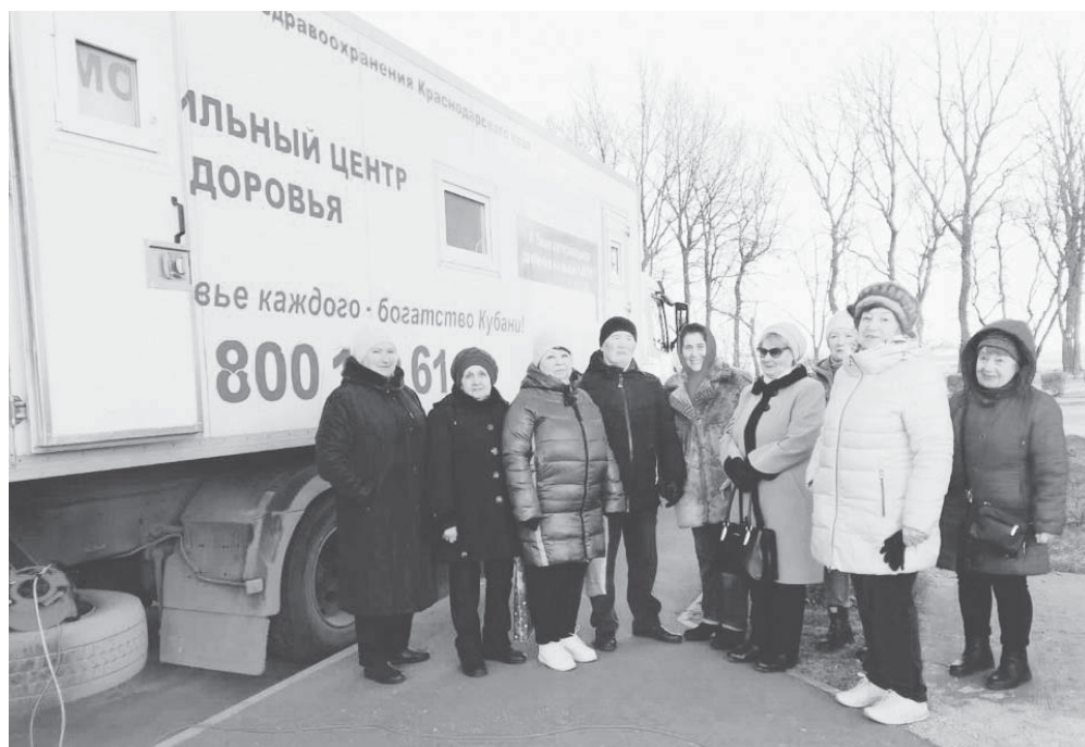
Мобильный центр здоровья Министерства здравоохранения Краснодарского края работает на территории 27-го избирательного округа