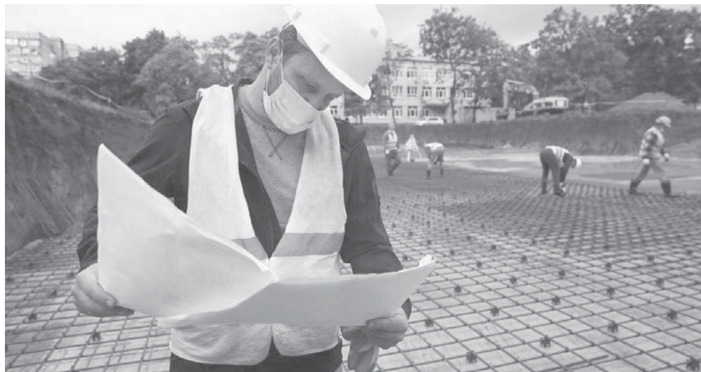
Подготовила Людмила БУРКИНА

В следующем году будет сдано в эксплуатацию шестнадцать детских садов, девять школ, детская поликлиника на триста посещений в микрорайоне Гидростроителей и физкультурно-оздоровительный комплекс по улице имени Вавилова, 37. На стадии проектирования находится порядка 26 учебных учреждений. Строительство образовательных учреждений идет за счет федеральных и краевых программ с софинансированием из муниципального бюджета.