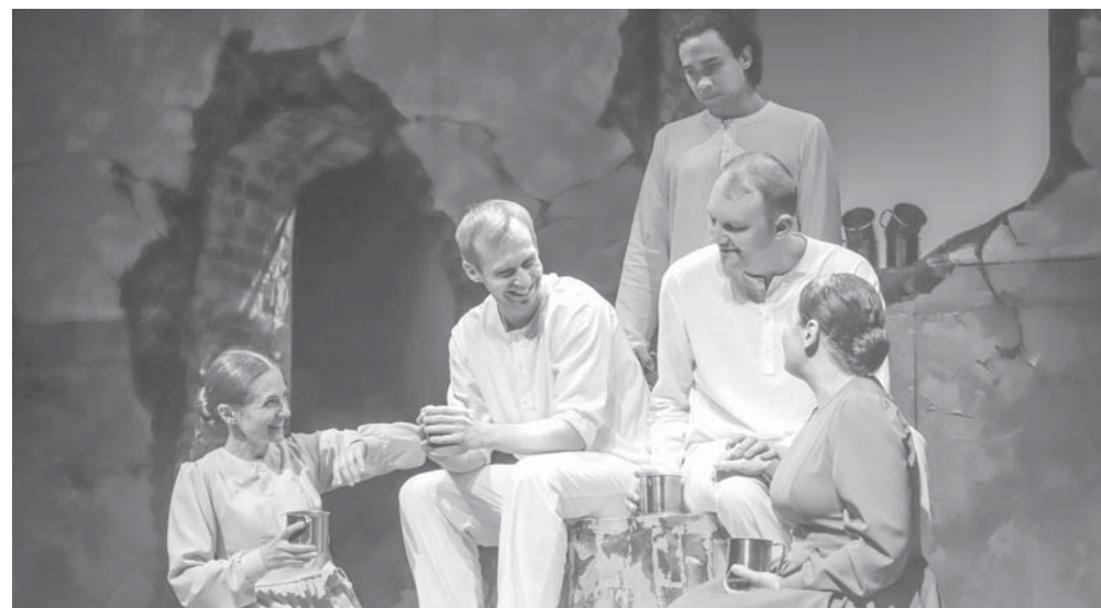
На снимке сцена из спектакля «Мамочки» Реклама

По завершении экскурсионной программы зрители смогут посмотреть спектакль «Мамочки» — историю о матерях, проводивших сыновей на фронт. Персонажи спектакля — обычные женщины, наделенные от природы главным талантом: умением любить. Они беззаветно любят своих сыновей и надеются на то, что материнская любовь вернет им сыновей из военной круговерти живыми и невредимыми.