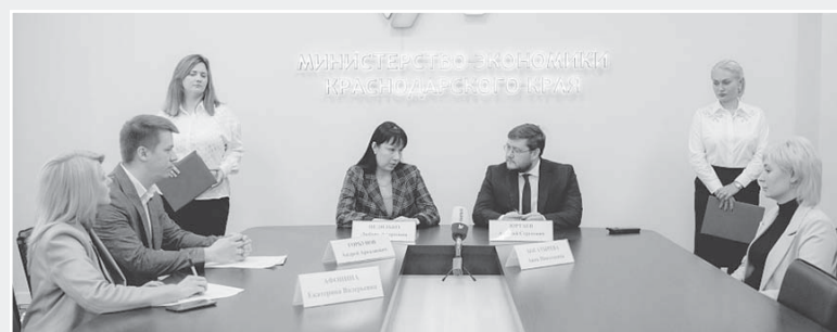
Министр экономики Краснодарского края Алексей Юртаев на подписании соглашения

Сейчас в нацпроекте участвуют 218 кубанских предприятий обрабатывающей промышленности, сельского хозяйства, строительства, транспорта, торговли. Для них предусмотрены различные виды господдержки: льготные займы регионального Фонда развития промышленности, отмена налога на имущество, инвестиционный налоговый вычет по налогу на прибыль до девяноста процентов, субсидии с повышающим коэффициентом, бесплатные образовательные программы.