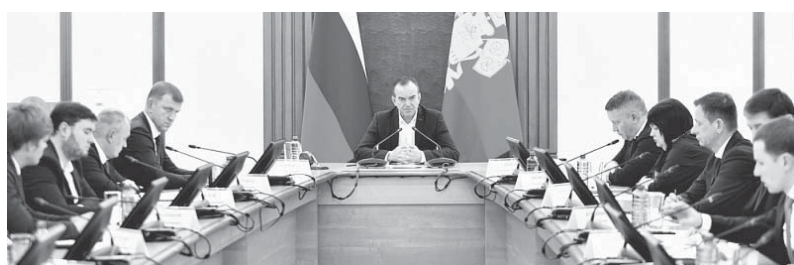
Глава администрации (губернатор) Краснодарского края Вениамин Кондратьев принял участие в заседании межведомственной комиссии

— Разрешения на строительство гостиниц и многоквартирных домов не учитывали достаточное количество парковочных мест, благоустройство и озеленение. Межведомственная комиссия подготовила