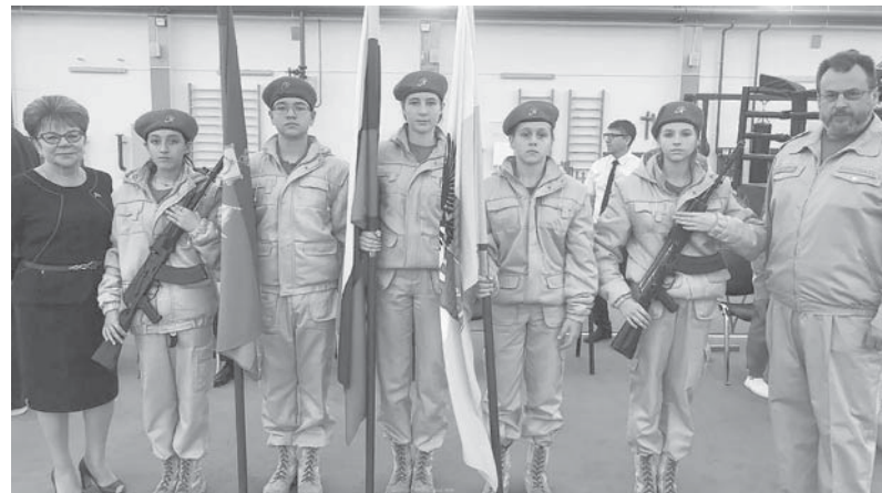
Участники краснодарского XII Окружного молодежного форума «Округ молодых — 2022»

В Краснодаре проходит XII Окружной молодежный форум «Округ молодых — 2022». Как рассказал глава администрации Карасунского внутригородского округа Николай Хропов, форум посвящен патриотическому воспитанию молодежи и предстоящему 80-летию со Дня освобождения Краснодара от немецко-фашистских захватчиков.