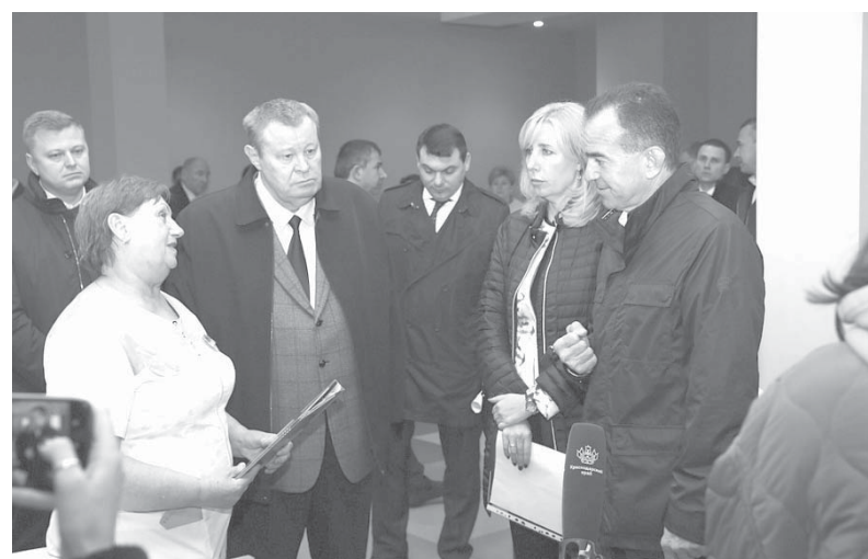
Глава администрации (губернатор) Краснодарского края Вениамин Кондратьев посетил пункты временного размещения жителей Херсонской и Запорожской областей

Владимир Устинов поблагодарил руководство Краснодарского