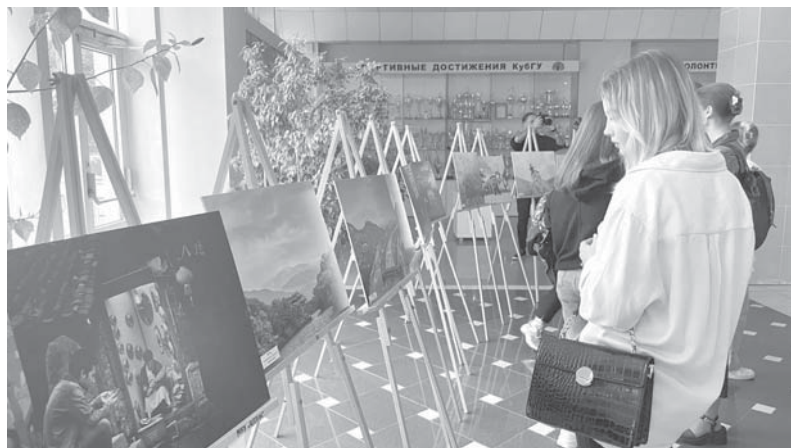
В КубГУ открылась молодежная фотовыставка

В Кубанском государственном университете открылась совместная молодежная фотовыставка Краснодара и Дуцзяньяня.