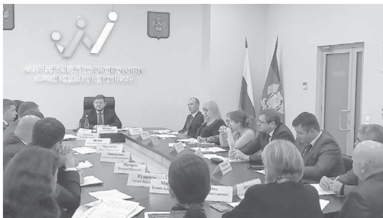
Министр экономики Краснодарского края Алексей Юртаев принял участие в рабочей встрече с ведущими банками и общественными организациями

Министр экономики Краснодарского края Алексей Юртаев принял участие в рабочей встрече с ведущими банками и общественными организациями. Были обсуждены вопросы обеспечения устойчивого развития экономики региона.