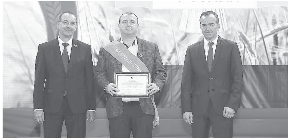
Глава администрации (губернатор) Краснодарского края Вениамин Кондратьев поздравил передовиков агропромышленного комплекса Кубани с получением достойного урожая

Работникам сельского хозяйства, показавшим лучшие результаты, вручили федеральные и краевые награды. Их получили четырнадцать человек.