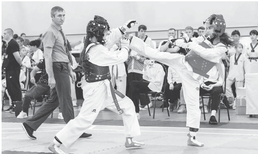
Боевое искусство — это долгий жизненный путь, в котором с каждым годом набираешься мастерства, знаний, умений, мудрости

Раньше ведь и футбол был сугубо мужским видом спорта, а сейчас развивается и женский. Есть тенденция, что девушек становится всё больше в дисциплинах, которыми раньше