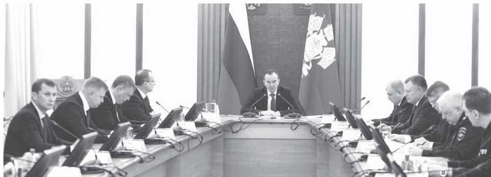
Глава администрации (губернатор) Краснодарского края Вениамин Кондратьев провел первое заседание оперативного штаба

Глава администрации (губернатор) Краснодарского края Вениамин Кондратьев провел первое заседание оперативного штаба, который создали в регионе в соответствии с указом президента России.