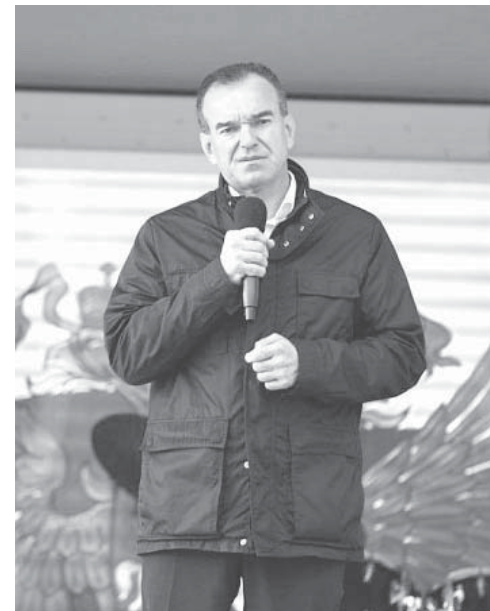
Глава администрации (губернатор) Краснодарского края Вениамин Кондратьев ознакомился с условиями подготовки мобилизованных жителей Кубани

Также мобилизованным Кубани единоразово выплачивают по сто тысяч рублей. Эти средства помогут семьям в первое время, пока военнослужащие не начнут получать зарплату. Согласно указу президента России она будет составлять не менее 195 тысяч рублей в месяц начиная с периода обучения.