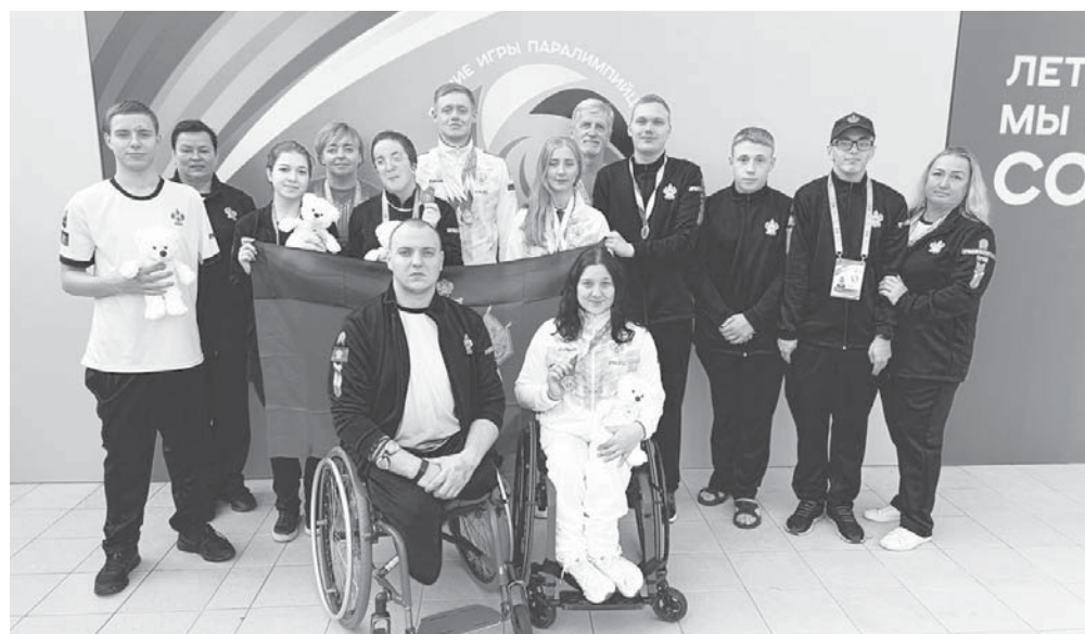
Сборная Краснодарского края выступила в Сочи очень успешно

Наилучшего для себя результата она добила на дистанции двести метров комплексным плаванием (класс SM5), где Наталья