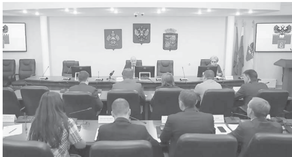
Исполняющий обязанности главы Краснодара Максим Слюсарев провел совещание, на котором обсудили работу ярмарок выходного дня

Исполняющий обязанности главы Краснодара Максим Слюсарев провел совещание, на котором обсудили работу ярмарок выходного дня.