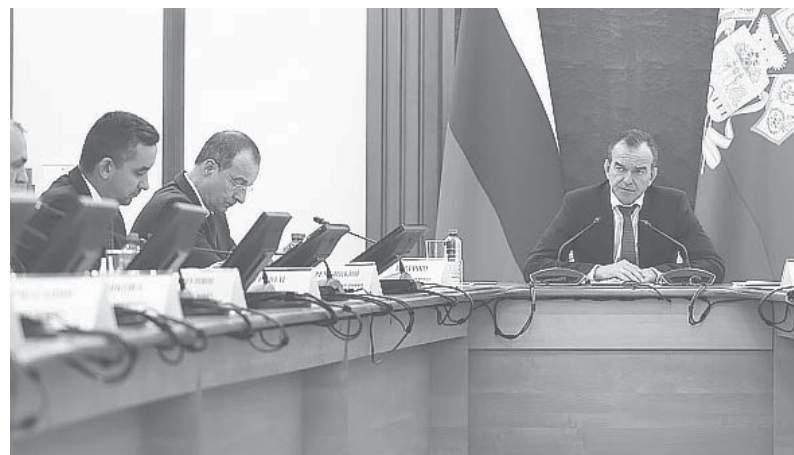
Глава администрации (губернатор) Краснодарского края Вениамин Кондратьев провел краевое совещание, на котором обсудили итоги подготовки к отопительному сезону

— Также модернизируем 51 котельную, причем тридцать две из них — за счет средств инвесторов. Начиная с 2020 года заключили девятнадцать концессионных соглашений в отношении систем теплоснабжения и горячего водо-