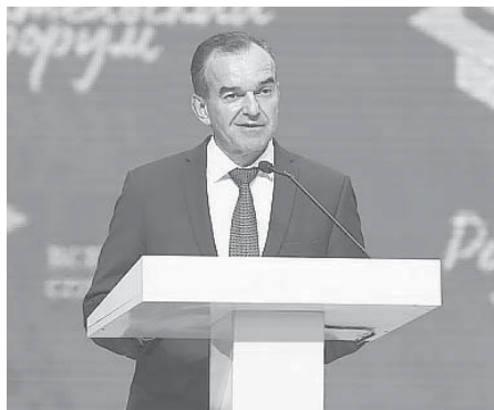
Глава администрации (губернатор) Краснодарского края Вениамин Кондратьев принял участие в пленарном заседании Всероссийского родительского форума

— В Краснодарском крае забота о детях, их физическом, нравственном и духовном развитии всегда была и остается важной