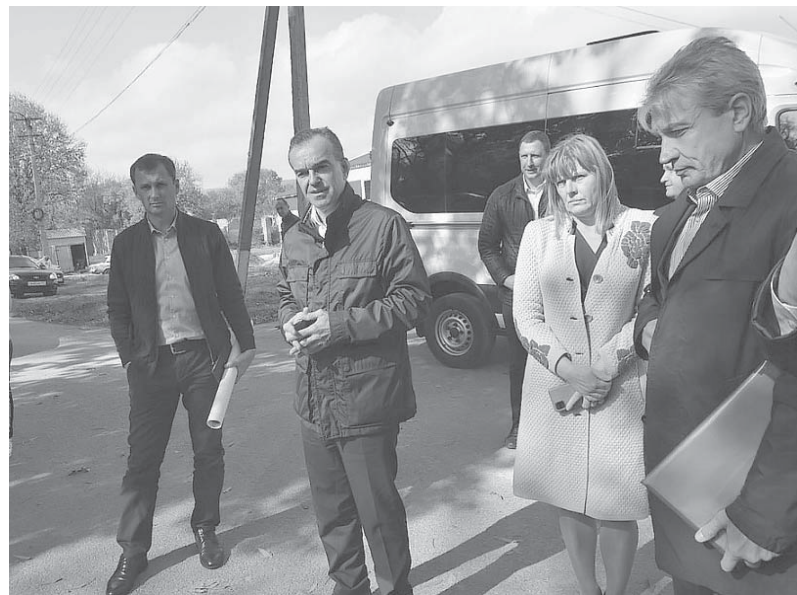
Глава администрации (губернатор) Краснодарского края Вениамин Кондратьев посетил с рабочим визитом муниципальное образование Отрадненский район

Глава администрации (губернатор) Краснодарского края Вениамин Кондратьев с рабочим визитом посетил муниципальное образование Отрадненский район.