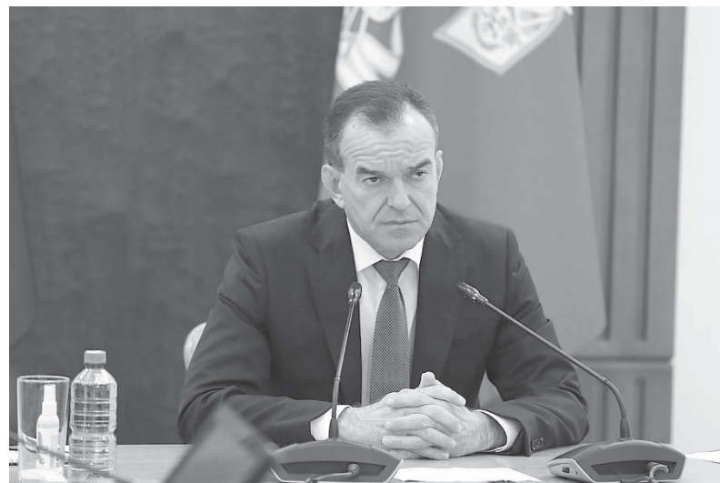
Глава администрации (губернатор) Краснодарского края Вениамин Кондратьев принял участие в заседании оперативного штаба

По поручению губернатора пострадавшим предоставят единовременные выплаты. Средства для этого уже выделили из резервного фонда края. Материальная