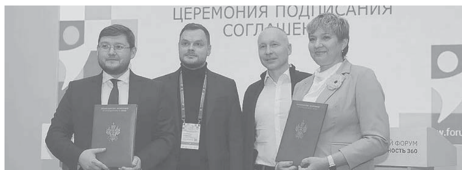
Министр экономики Краснодарского края Алексей Юртаев рассказал об участии кубанской делегации в форуме «Производительность 360»

Министр экономики Краснодарского края Алексей Юртаев рассказал об участии кубанской делегации в форуме «Производительность 360».