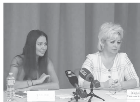
На брифинге, посвященном теме вакцинации

Накануне в Краснодаре стартовала прививочная кампания против гриппа. Перед процедурой врач проводит медицинский осмотр и определяет возможные противопоказания. Только после этого человек получает вакцину.