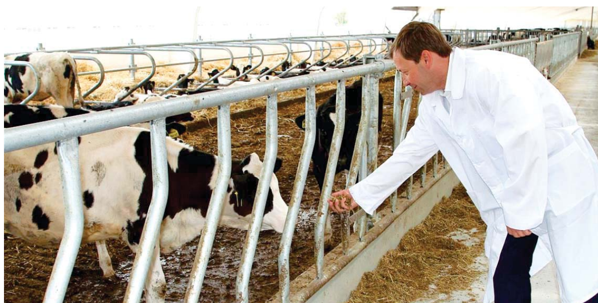
В рейтинге регионов России край занимает третье место по объемам производства молока в хозяйствах всех категорий

Поголовье свиней сегодня в крае составляет 678,7 тыс., овец и коз — 227,6 тыс. По этим видам