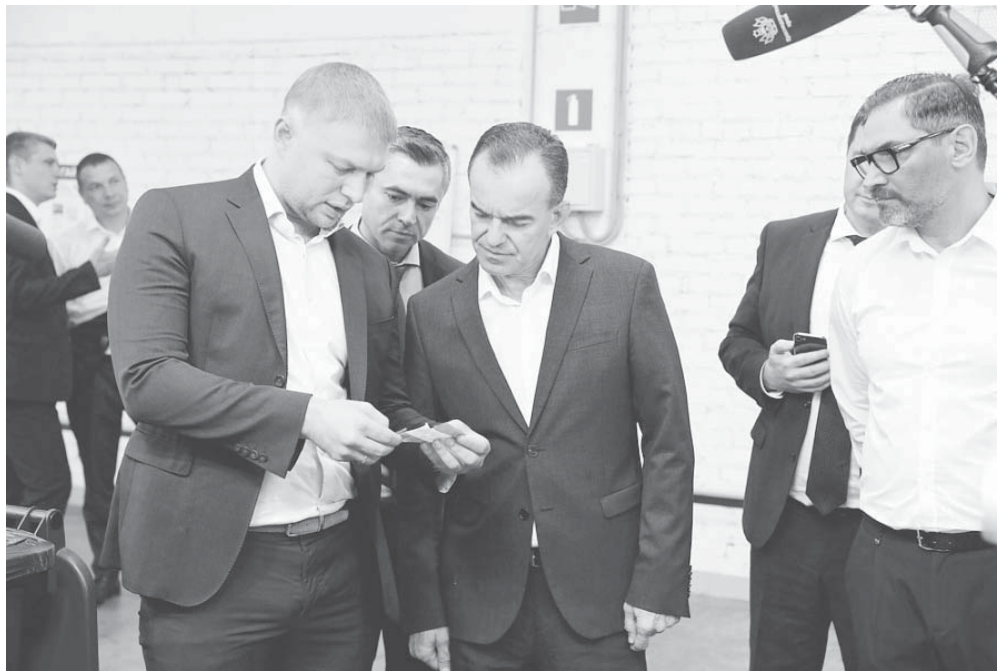
Глава администрации (губернатор) Краснодарского края Вениамин Кондратьев провел рабочую встречу с генеральным директором предприятия, производящего самоклеящиеся этикетки

Было озвучено, что с 2019 года компания присоединилась к нацпроекту «Производительность труда». Вениамин Кондратьев отметил, что за четыре года предприятие получило 143 миллиона рублей в виде субсидий из краевого бюджета и льготных займов из регионального и федерального фондов развития промышленности. Это позволило