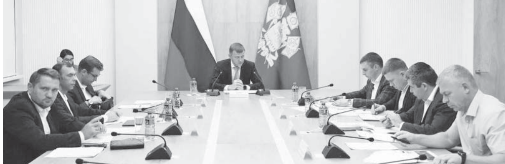
Заместитель главы администрации (губернатора) Краснодарского края Евгений Наумов провел совещание

В совещании также принял участие глава Департамента строительства края