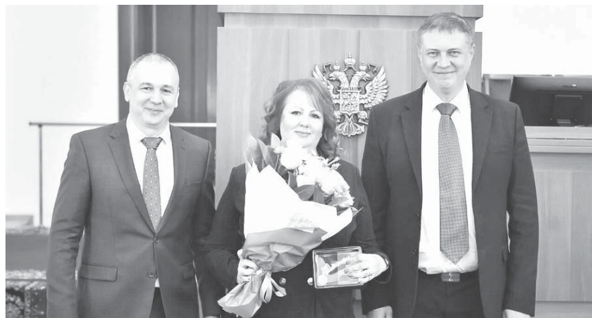
Глава администрации (губернатор) Краснодарского края Вениамин Кондратьев поздравил коллектив Министерства финансов края с профессиональным праздником

Министр финансов Александр Кнышов отметил, что Краснодарский край сегодня в пятерке регионов России по объему налоговых и неналоговых доходов консолидированного бюджета: за 2021 год поступило 364 миллиарда рублей. Увеличены инвестиционные расходы краевого бюджета.