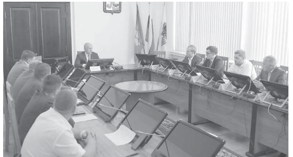
Исполняющий обязанности главы города Краснодара Максим Слюсарев провел совещание по подготовке к предстоящему осенне-зимнему периоду

Специалисты компании «Краснодарэлектросеть», филиала АО «НЭСК-электросети», отремонтировали свыше 410 трансформаторных подстанций, 503 километра линий электропередачи 0,4 кВ и 203 километра линий электропередачи 6–10 кВ, построили четыре новые трансформаторные подстанции, еще двенадцать реконструировали. Кругло-