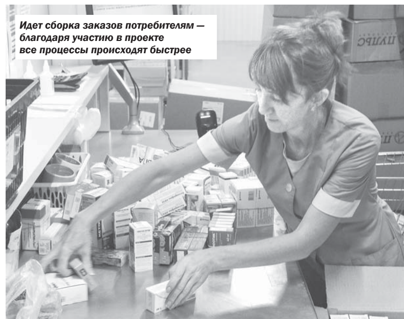
Идет сборка заказов потребителям — благодаря участию в проекте все процессы происходят быстрее

Когда увидели, что это реальные потери, появилась идея: сделать стоянку для лесенок. Так в каждом