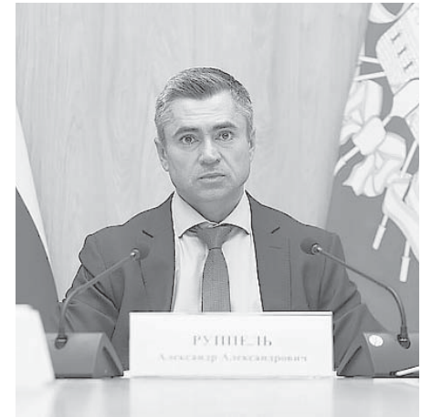
Заместитель главы администрации (губернатора) Краснодарского края Александр Руппель на совещании, посвященном инвестпроектам

— Для нашего края сроки получения документов для реализации инвестпроектов всегда были проблемным вопросом. Благодаря проекту мы рассчитываем сократить это время в среднем в два раза. Мы привлекли к работе более пятидесяти