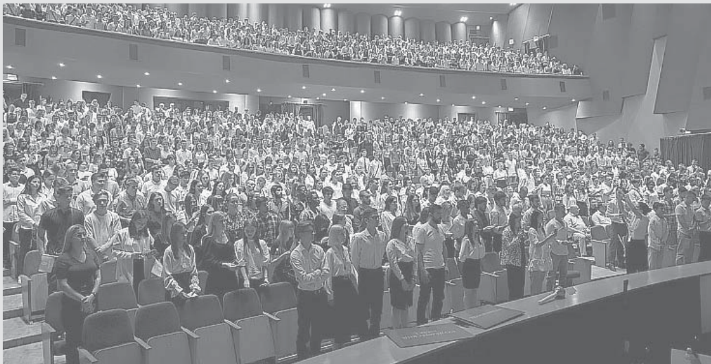
Подготовила Марина ВЛАДИМИРОВА, Фотографии предоставлены пресс-службой ЗСК

Завершился праздник концертом творческих коллективов КубГАУ.