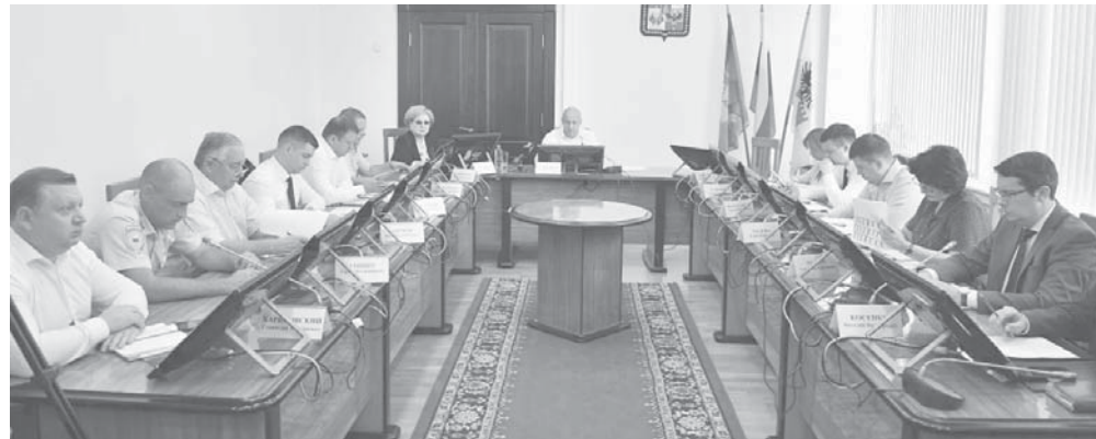
Исполняющий обязанности главы города Максим Слюсарев провел совещание, посвященное месячнику по наведению санитарного порядка и благоустройству

Исполняющий обязанности главы города Максим Слюсарев провел совещание, на котором обсудили стартовавший в Краснодаре общегородской месячник по наведению санитарного порядка и благоустройству.