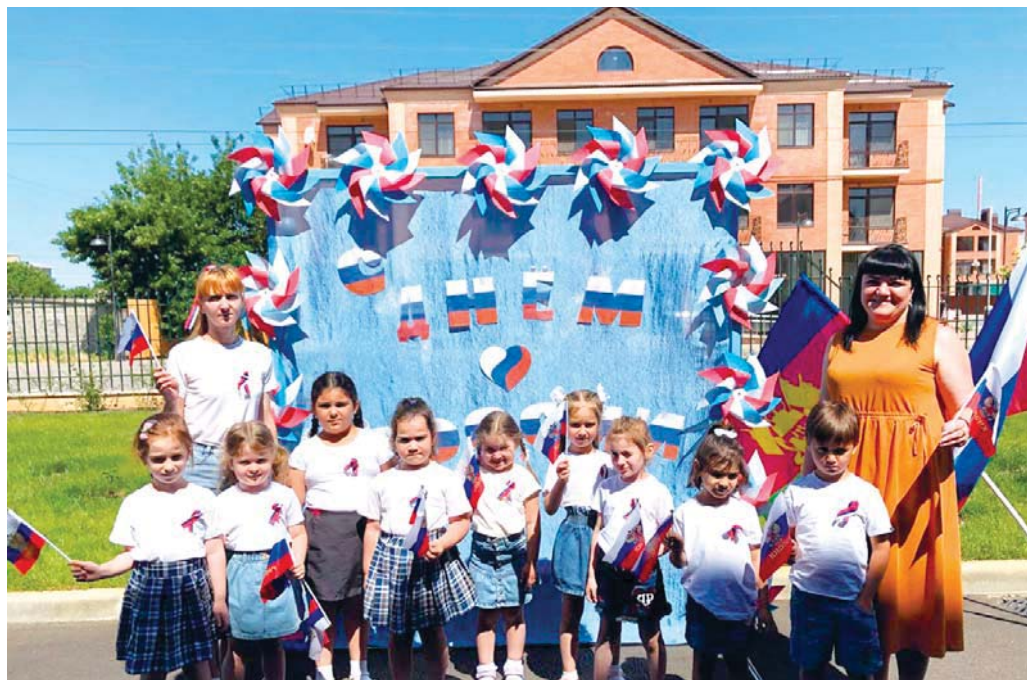
А это — его счастливые воспитанники