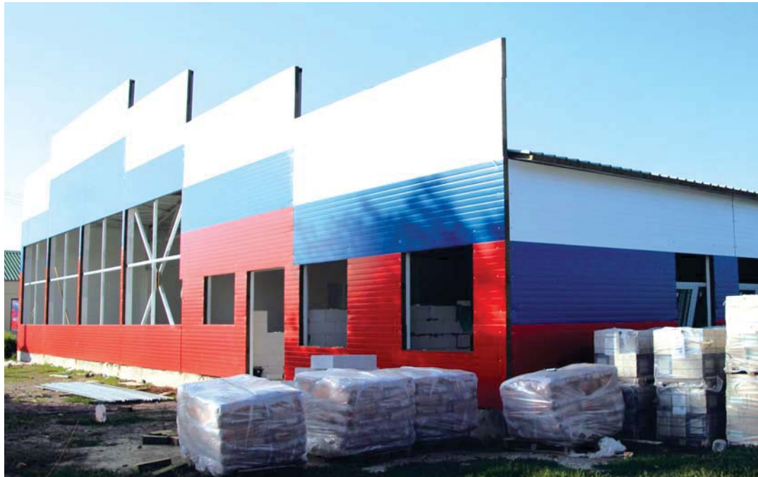
Завершается строительство центра единоборств, который откроется в этом году