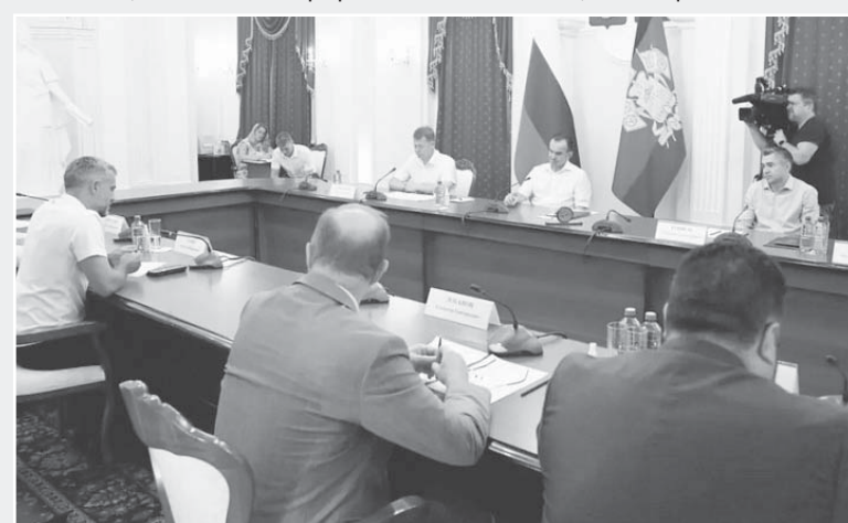
Глава администрации (губернатор) Краснодарского края Вениамин Кондратьев обсудил возможность развития на Кубани малой авиации

Помочь в решении этой задачи могут студенты КубГУ, в котором есть факультет машиностроения, технология восстановления деталей двигателей, моделирование систем