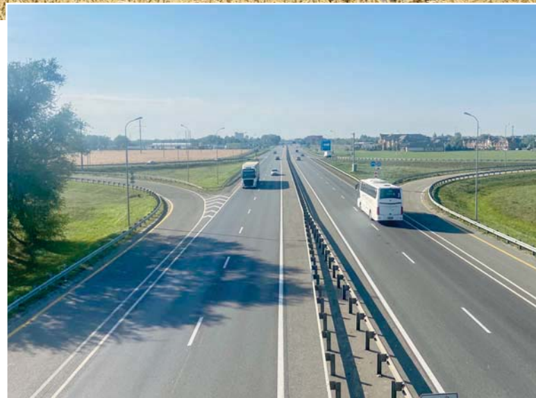
Пятьдесят километров трассы М4 «Дон» проходят по территории Кушевского района

Пример, который нас к этому пути подтолкнул, позитивным никак не назовешь: ситуация с горбатым мостом, как его называют в народе. Ввиду выявленного аварийного состояния в Кушевской недавно закрыли краевой автомобильный мост через железно-