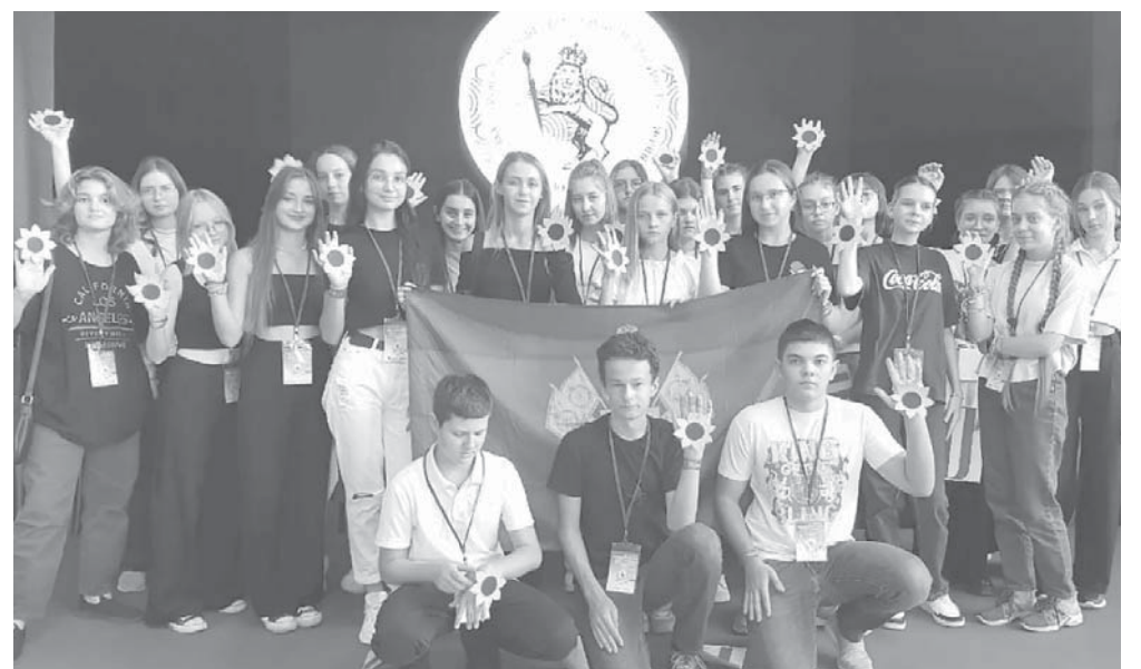
Воспитанники краснодарской Детской школы искусств №2 на международном пленэре юных художников «Душа народа, его сила и гордость», прошедшем во Владимире и Суздале