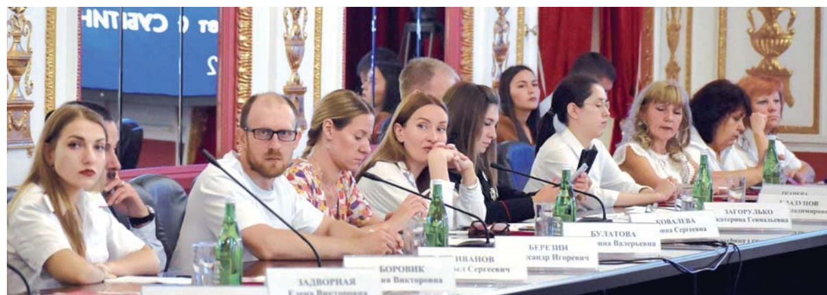
В заседании выездной комиссии приняли участие руководители пресс-служб реестровых казачьих войск и помощники атаманов по СМИ Кубанского казачьего войска