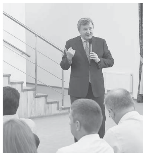
На городском августовском педсовете участники обсудили особенности образовательного процесса в 2022/23 учебном году

В Краснодаре в формате образовательного форума прошел городской августовский педсовет, основной темой которого стали особенности образовательного процесса в 2022/23 учебном году. Также педагоги обсудили основные направления работы, роль учителя в современной школе, умение вести воспитательный процесс.