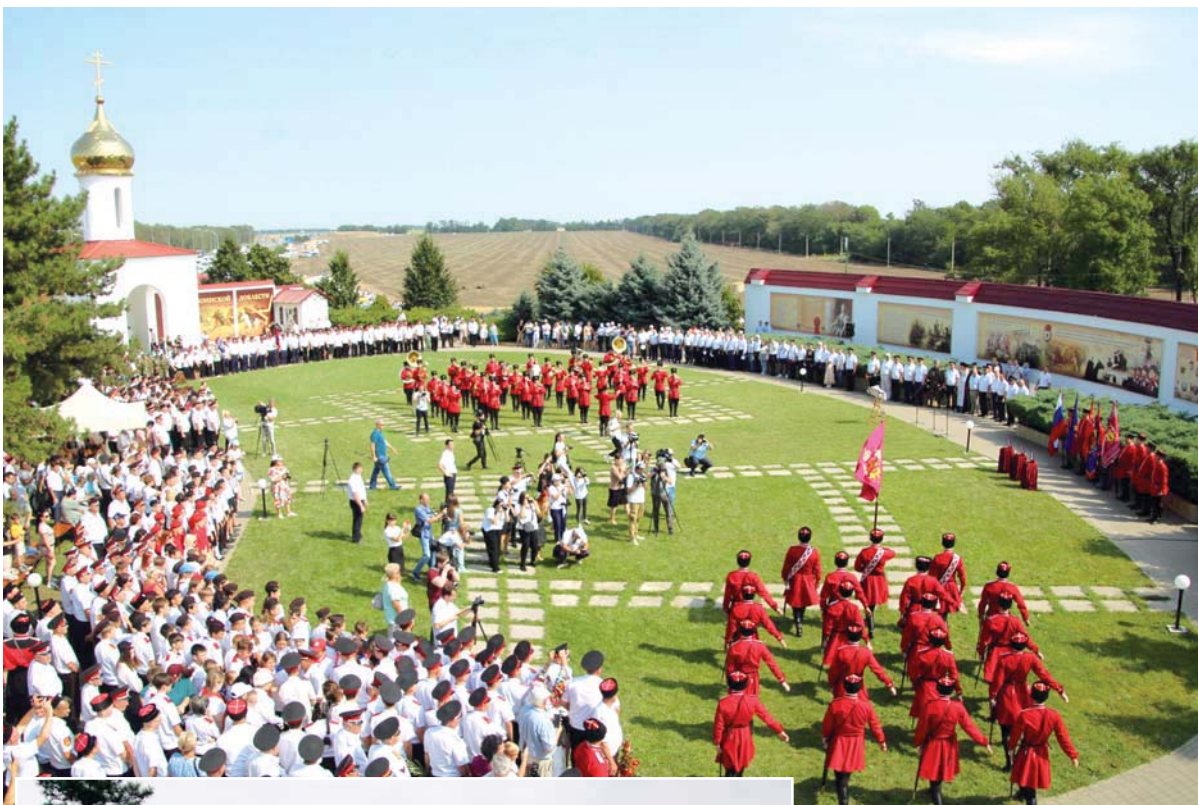
В мемориальном комплексе «Поле казачьей славы» в станице Кушевской второго августа 2022 года

— Первое впечатление у автолюбителей формируют дороги. Наш край считается регионом, где их качество отмечается высокими оценками