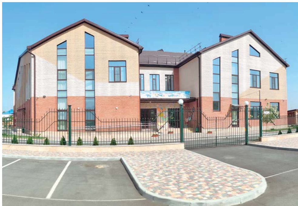
Такому детскому саду могут позавидовать в больших городах

— Вряд ли найдется хоть одна федеральная или краевая программа, в которую бы мы не подавали документы. В большинстве случаев наш район включают в эти проекты, и на этом пока всё. Но мы продолжаем работу в этом направлении, потому что Кушевский район является визитной