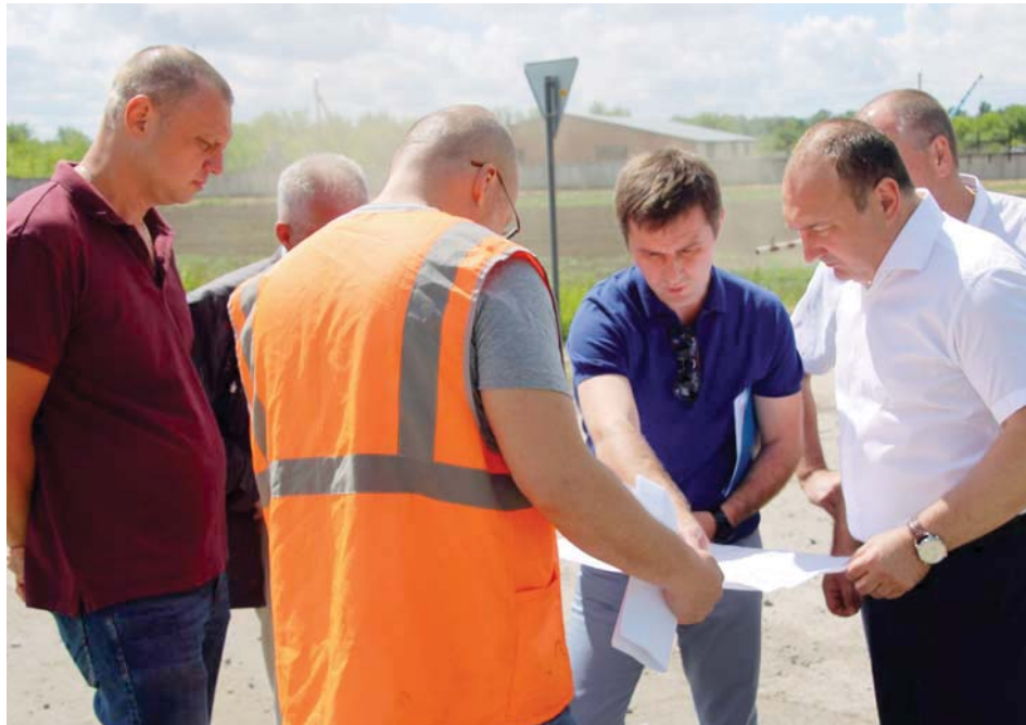
Вопрос ремонта путепровода — «горбатого моста» над железной дорогой — жизненно важен для района. Совещания рабочей группы проходят при непосредственном участии главы муниципалитета