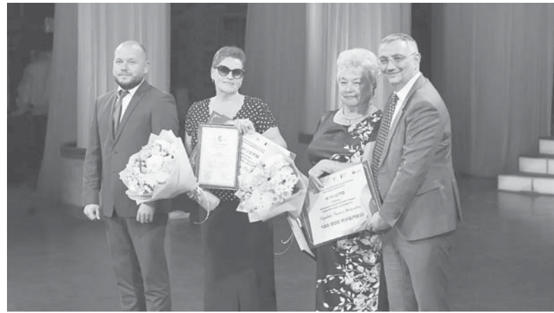
На торжественной церемонии награждения победителей городского конкурса

— Благодаря руководителям ТОСов и их активности Краснодар приобретает современный об-