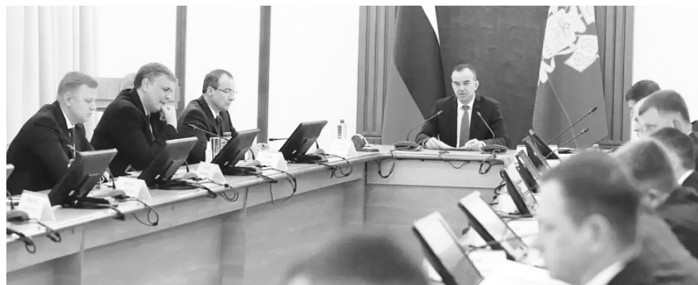
Глава администрации (губернатор) Краснодарского края Вениамин Кондратьев провел совещание по вопросу реализации национальных проектов

Он также сказал, что на особом контроле остается строительство общественно значимых объектов. До конца года в крае должны достроить одиннадцать фельдшерско-акушерских пунктов, водозабор и очистные сооруже-