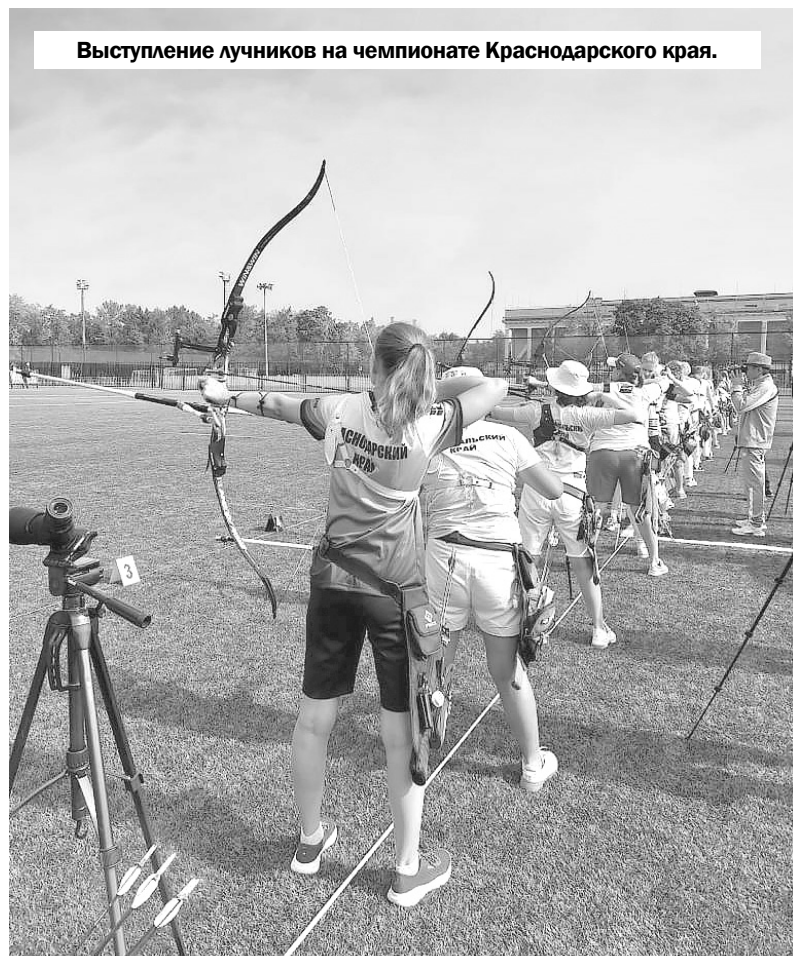
Выступление лучников на чемпионате Краснодарского края.

самым он подходит для многих категорий людей. Вообще в стрельбе из лука часто на равных участвуют как обычные спортсмены, так и спортсмены с ПОДА (поражением опорно-двигательного аппарата). И они составляют достойную конкуренцию. На соревнованиях можно одновременно видеть спортсменов стоя и на колясках, находящихся на одной линии стрельбы.