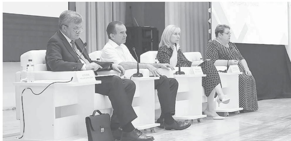
Глава администрации (губернатор) Краснодарского края Вениамин Кондратьев принял участие в совещании, на котором обсудили развитие сферы образования

— Муниципалитеты Кубани активно участвуют в федеральных и краевых программах, благодаря которым модернизируют и благоустраивают существующие школы. В этом году мы удвоили финансирование на капитальный ремонт: направили 2,9 миллиарда рублей. Эти средства