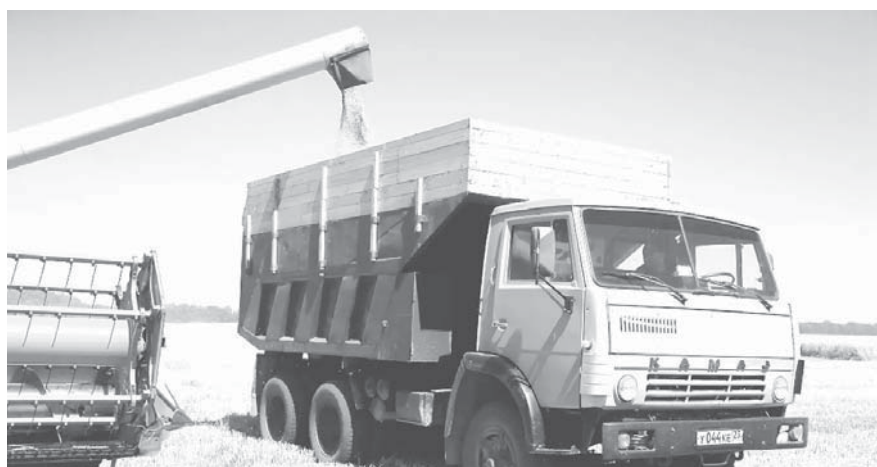
В краевом центре завершается уборочная кампания

Он отметил, что в этом году аграрии собрали 72877 тонн основной хлебной культуры — озимой пшеницы — со средней урожайностью 70 центнеров с гектара.