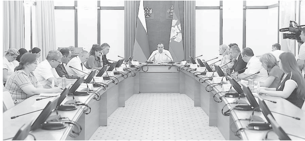
Глава администрации (губернатор) Краснодарского края Вениамин Кондратьев провел совещание, посвященное вопросам качества организации школьного питания

— Нужно использовать лучшие практики и распространять их по всему региону.