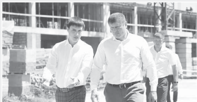
Глава города Краснодара Андрей Алексеенко в поселке Российском

Глава города Краснодара Андрей Алексеенко в ходе рабочего объезда оценил комплексное развитие поселка Российского.