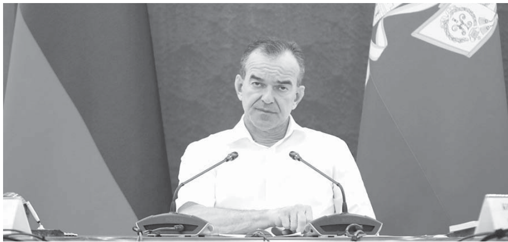
Глава администрации (губернатор) Краснодарского края Вениамин Кондратьев подвел итоги работы с обращениями граждан в первом полугодии 2022 года

— Уверен, что количество жалоб в муниципалитетах пропорционально количеству встреч глав районов с жителями. Там, где руководитель общается открыто, проблемы решаются намного конструктивнее. Необходимо действовать на опережение. Люди ждут от нас работы в рамках конкретного