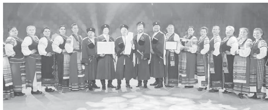
Народный казачий хор «Елизаветинцы» принял участие в XVI Международном фестивале народного творчества «Венок дружбы»