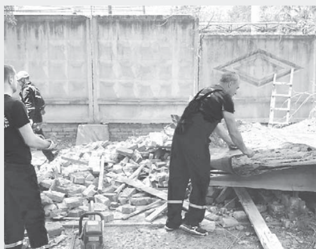
Подведены промежуточные итоги работы по очистке краевого центра от самовольно возведенных зданий и сооружений