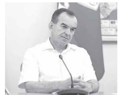
Глава администрации (губернатор) Краснодарского края Вениамин Кондратьев на рабочей встрече

Было озвучено, что Совет по развитию гражданского общества и правам человека в Краснодарском крае тесно сотрудничает с социаль-