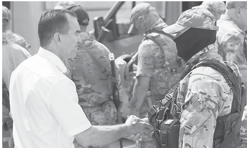
Глава администрации (губернатор) Краснодарского края Вениамин Кондратьев поздравил кубанских военнослужащих

— Вы мужественно выполняете свой долг, потому что понимаете: по-другому нельзя остановить нацизм. Вы защищаете интересы государства, жизни простых людей и память наших предков. Без этого нам нет смысла мечтать, строить планы. Сегодня России служат державные люди. Вы главная сила