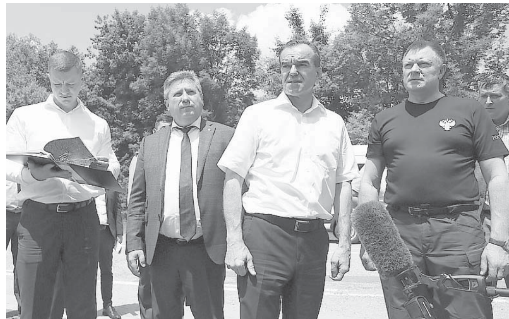
Глава администрации (губернатор) Краснодарского края Вениамин Кондратьев с рабочим визитом в Апшеронском районе

Район на 42-м месте по привлечению инвестиций. Как минимум за последние пять лет в районе не реализовали ни одного крупного проекта. Муниципалитет показывает недостаточную заинтересованность в