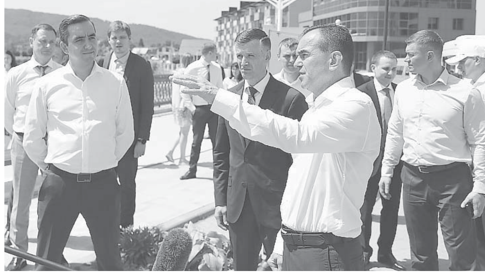
Глава администрации (губернатор) Краснодарского края Вениамин Кондратьев проинспектировал ряд объектов в Горячем Ключе

За эти средства отремонтируют въездную группу: улицы Революции, Объездную, Кучерявого и часть Псекупской. Необходимые документы для участия в краевой программе по этим участкам уже разработали. Также проложат более одного километра тротуаров. Со следующего года в районе планируют перевести из грунтового в асфальтобетонное покрытие полтора километра дорог.