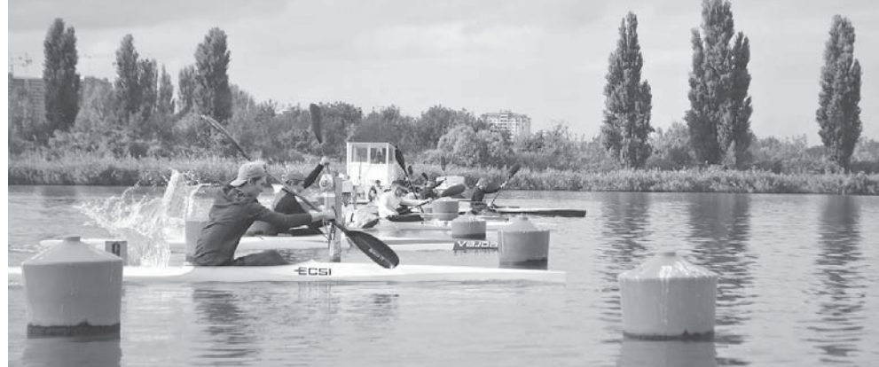
Заплыв кубанских гребцов

Тренировочный процесс проходит в полном объеме. Уменьшилось количество международных выездов, в них не смогут принять участие отобравшиеся спортсмены. Но сказать, что спортсмены поникли, — нет. Они также проходят тренировки, выступают на разных соревнованиях. К примеру, в двадцатых числах мая прошли международные соревнования — Открытый кубок Республики Беларусь, в нем приняла участие в том числе сборная команда России, в которую вошли пять гребцов из Краснодарского края. С новыми санкциями для нас практически ничего не изменилось.