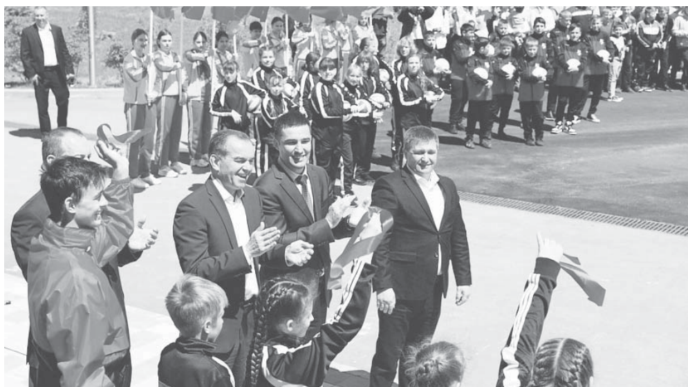
Глава администрации (губернатор) Краснодарского края Вениамин Кондратьев принял участие в открытии спортивного центра

Глава администрации (губернатор) Краснодарского края Вениамин Кондратьев принял участие в открытии самого крупного в Курганинском районе спортивного центра.