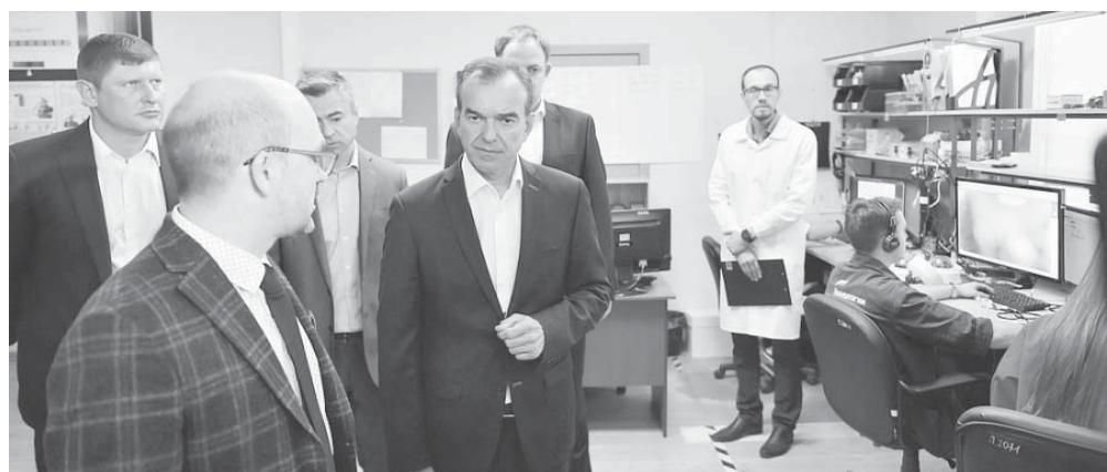
Глава администрации (губернатор) Краснодарского края Вениамин Кондратьев провел рабочую встречу

После осмотра центра участники встречи обсудили планы по дальнейшему развитию предприятия. Вениамин Кондратьев отметил значимость производства систем видеонаблюдения именно в Краснодарском крае.